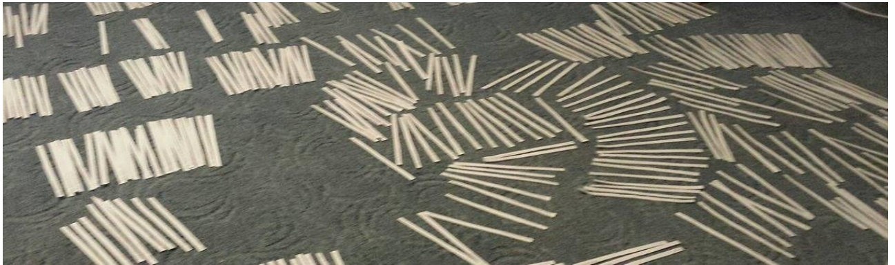
3 pav. apjungimas į kekes

VI etapo metu kiekvienai temų kekei suteikiamas pavadinimas. Temos jungiamos į metatemas, t.y. ieškoma bendrumų tarp atvėjų. Metatema tampama, kai bent pusei dalyvių ji tinka.