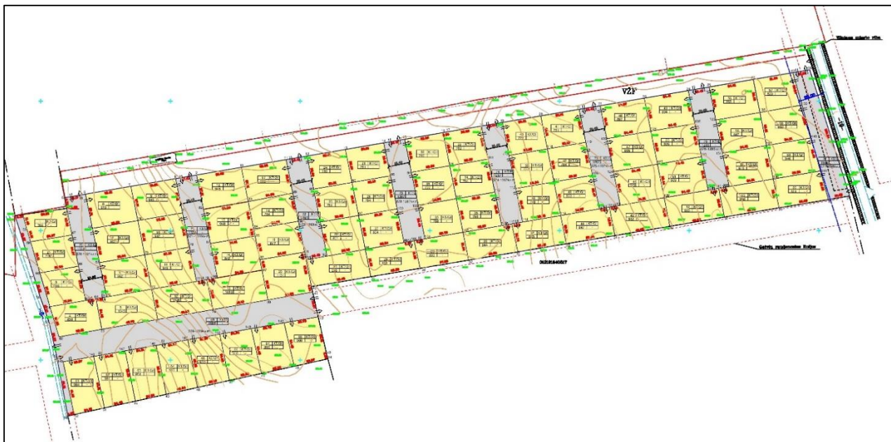
1 pav. Formavimo ir pertvarkymo projektu pertvarkomo žemės sklypo schema 48

Kaip pavyzdį galima pateikti situaciją, kai didelio ploto (apie 7,5 ha) „Žemės ūkio“ pagrindinės naudojimo paskirties žemės sklypas padalinamas į 68 „Kitos“ paskirties bei „Vienbučių ir dvibučių gyvenamųjų pastatų teritorijos“ 47 naudojimo būdo sklypus (1 pav.).