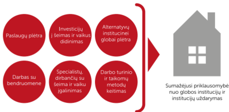
1 pav. Deinstitutionalizacijos komponentai (pagal „Žiburio“ labdaros ir paramos fondą 2016)

Pateiktas paveikslėlis leidžia daryti prielaidą, kad deinstitutionalizacija susideda iš tam tikrų komponentų (žr. 1 pav.)