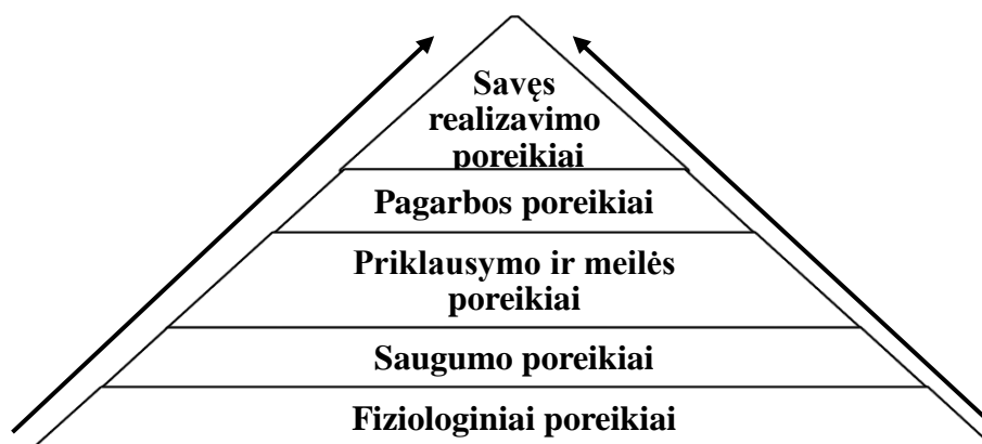
1 pav. A. Maslow poreikių hierarchijos piramidė (sudaryta pagal, D. Myers, 2000)

Poreikių teorijų tarpe plačiausiai paplitusi yra A. Maslow žmogaus poreikių teorija. Esminis vaidmuo šioje teorijoje skiriamas poreikiams, kuriuos autorius suskirsto pagal svarbą ir patenkinimo eiliškumą (1 pav.). Tad vienas iš būdų suprasti vaiko poreikius yra pažvelgti į A. Maslow poreikių hierarchiją.