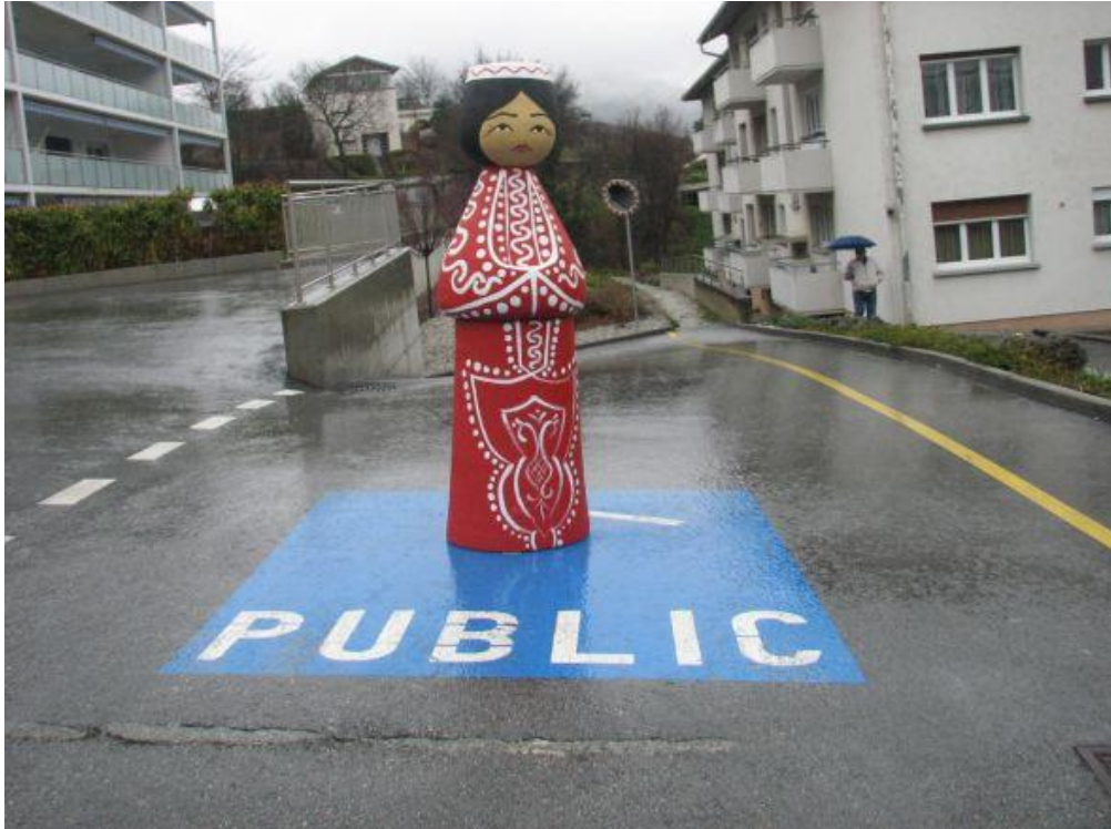
17. Juozas Laivys, Pupe , 2013, polistireninis putplastis, dažai, 160x50, nuotrauka autoriaus, Šveicarija, 2013, menininko nuosavybė Juozas Laivys, Pupe , polystyrene foam, paint