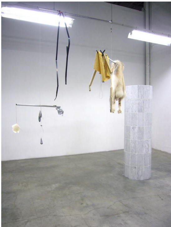
20. Aymeric'as Ebrard'as, Schwarzschild'o spindulys , 2010, instaliacijos vaizdas, Prancūzija: Palais de Tokyo, 2010, menininko nuosavybė Aymeric Ebrard, Ray of Schwarzschild , installation view