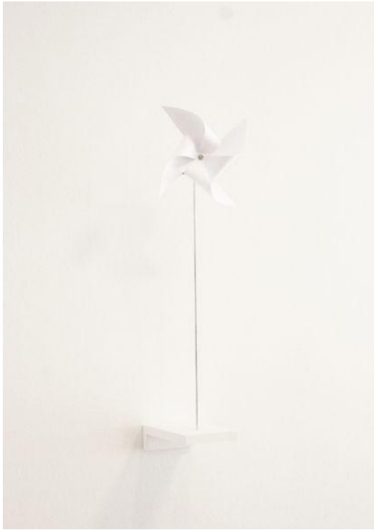
19. Simon'as Nicaise, Be pavadinimo , 2012, nerūdijančio plieno virbas, kvarcinis laikrodis, popierius, 47x17, nuotrauka autoriaus, Prancūzija, 2012, privati kolekcija Simon Nicaise, Untitled , stainless steel rod, quartz clock, paper