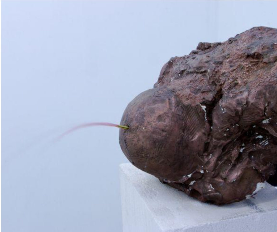
15. Andrius Svilys, 01-Būdamas kambaryje girdžiu fontaną , 2013, instaliacijos fragmentas, nuotrauka Nerijaus Jankausko, Lietuva, 2013, menininko nuosavybė Andrius Svilys, 01- While Beeing In a Romm I Hear a Fountain , installation view