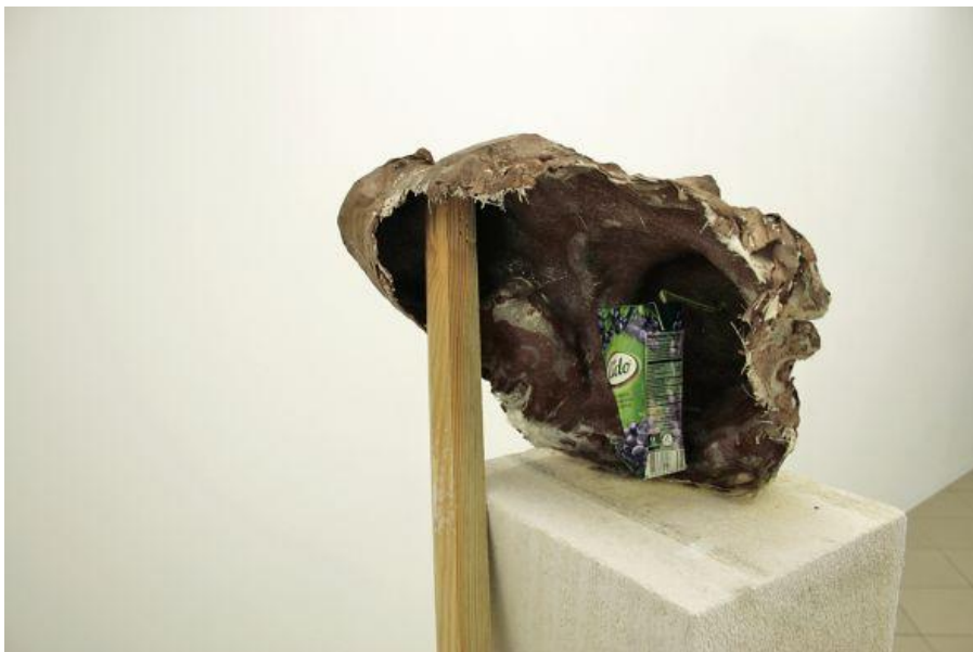
16. Andrius Svilys, 01-Būdamas kambaryje girdžiu fontaną , 2013, instaliacijos fragmentas, nuotrauka Neringos Bumblienės, Lietuva, 2013, menininko nuosavybė Andrius Svilys, 01- While Beeing In a Romm I Hear a Fountain , installation view