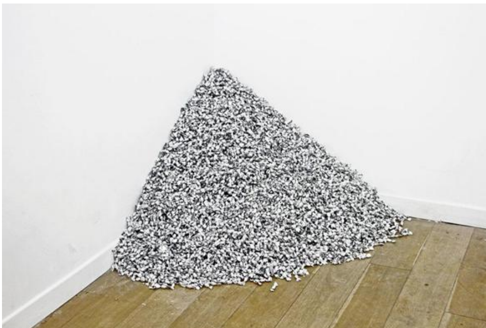
18. Simon'as Nicaise, Be pavadinimo (placebas) , 2010, saldainiai suvynioti į sidabro spalvos popierėlius, dydžiai kintantys, nuotrauka autoriaus, Prancūzija, 2012, privati kolekcija Simon Nicaise, Untitled (Placebo) , candies wrapped in silver color paper