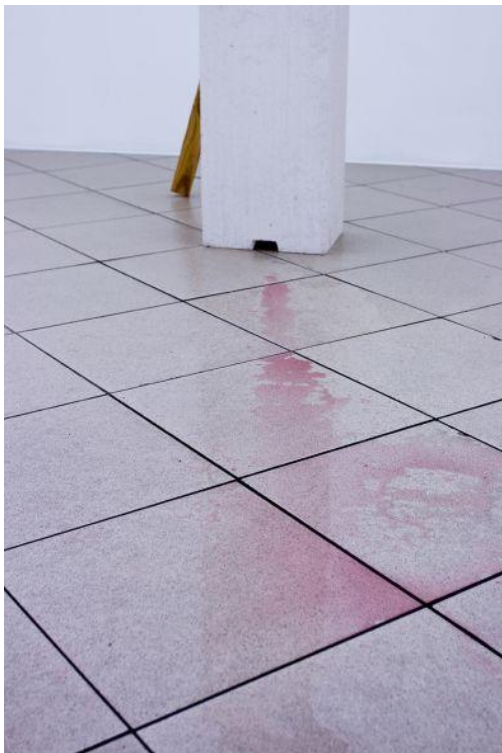
14. Andrius Svilys, 01-Būdamas kambaryje girdžiu fontaną , 2013, instaliacijos fragmentas, Lietuva, 2013, menininko nuosavybė Andrius Svilys, 01- While Beeing In a Romm I Hear a Fountain , installation view