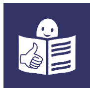
0.1 pav. Lengvai suprantamos kalbos simbolis

Renkantis leidinius paslaugų gavėjams su proto negalia, socialinis darbuotojas turi ieškoti leidinio, kurio viršelyje pavaizduotas lengvai suprantamos kalbos simbolis (žr. 2.1.1 pav.) (Tarptautinė organizacija Inclusion Europe, 2017.)