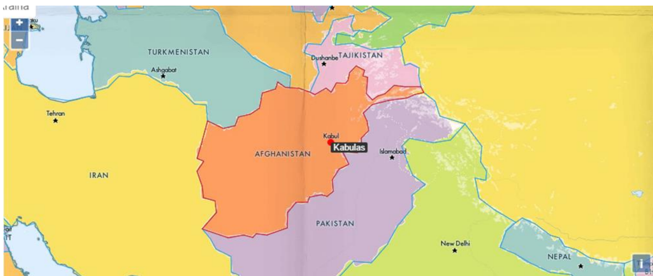
1 pav. Geografinis Afganistano išsidėstymas 131