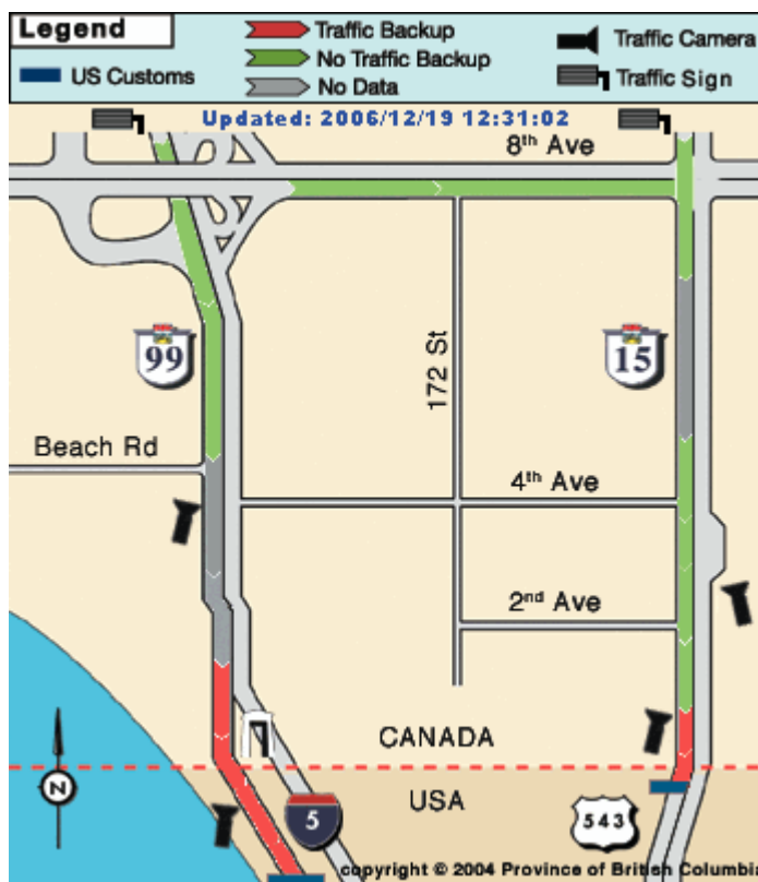
6 pav. Pasienio kontrolės postai bei privažiavimo prie jų keliai

Internetiniame puslapyje rodomas tam tikros sienos atkarpos žemėlapis, kuriame pavaizduoti pasienio kontrolės postai bei privažiavimo prie jų keliai. (Žr. 6 pav.)