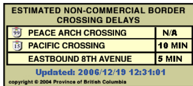
8 pav. Laukimo laikas pasienio kontrolės punktuose

Papildomai tinklapis pateikia sienos atkarpos pasienio kontrolės punktų lentelę, kurioje rodomas laukimo laikas per kurį bus pasiektas pasienio kontrolės punktas. (Žr. 8 pav.)