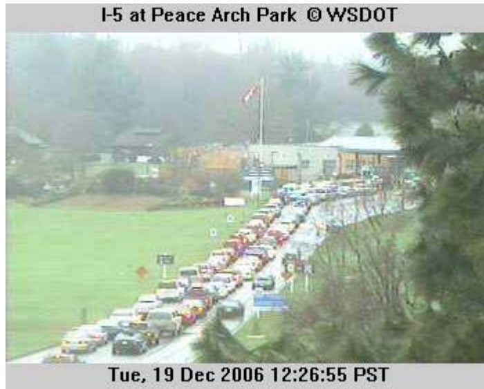
7 pav. Privažiavimo prie pasienio kontrolės punkto kelio atkarpos vaizdas

Papildomai tinklapis pateikia sienos atkarpos pasienio kontrolės punktų lentelę, kurioje rodomas laukimo laikas per kurį bus pasiektas pasienio kontrolės punktas. (Žr. 8 pav.)