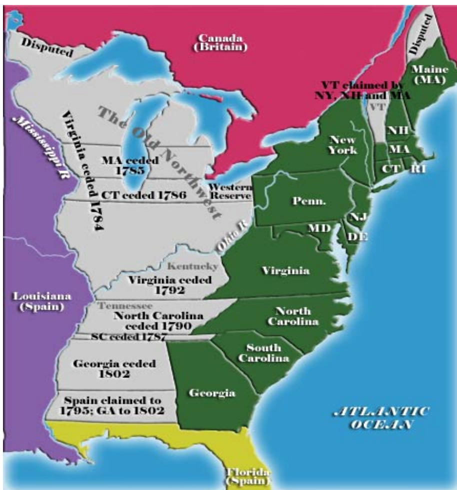
5 pav. Valstijų ekspansija į Vakarus 57

XVIII a. 8-ojo dešimtmečio pabaigoje septynios iš trylikos valstijų turėjo labai ryškių pretenzijų dėl žemių Vakaruose. Šios septynios žemes turinčios valstijos turėjo aiškų pranašumą prieš šešias „bežemes“ valstijas.