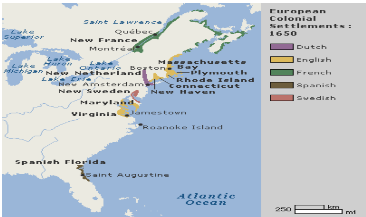
1 pav. Šiaurės Amerikos kolonijos 1650 m. 7

tiekti prekybai tinkamos produkcijos, bet ir derinti valdžios pasidalinimo klausimus. Todėl po trijų metų 1609 m. gegužės 3 d. sekė Antroji Virdžinijos chartija 5 , kuri buvo papildyta naujais žmonėmis iš Senosios Anglijos, tačiau ir tai nedavė laukiamų rezultatų. Išleista Trečioji Virdžinijos chartija 6 1612 m. kovo 12 d. bandė sutvarkyti susidariusią situaciją atsiunčiant konsultantus ir patarėjus, tačiau situacija iš esmės nesikeitė ir 1624 metais Virdžinijos kolonija perėjo į karališkojo sosto rankas.