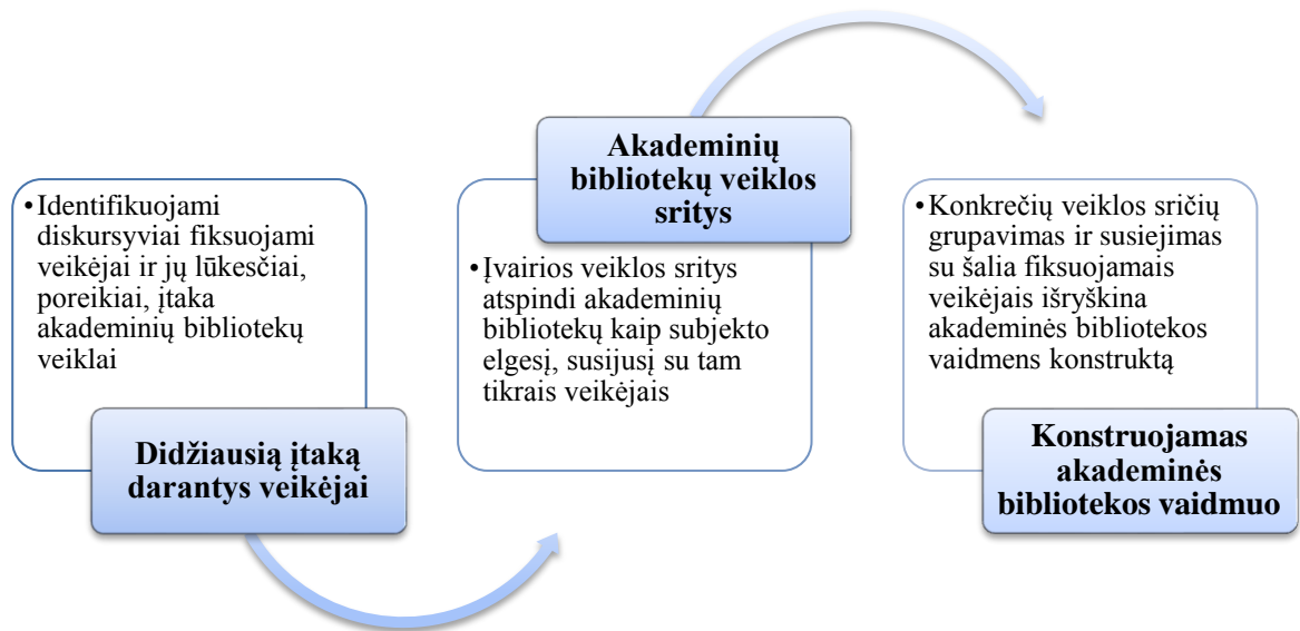
1 pav. Akademinės bibliotekos vaidmens sudėtinės dalys

Veiklos sąvoka šiame darbe traktuojama kaip tam tikras veikimas, darbas (Dabartinės lietuvių kalbos..., 2000, p. 917) ir atspindi visumą akademinės bibliotekos daromų operacijų, veiksmų ir teikiamų paslaugų. Skirtumas tarp veiklos ir vaidmens sąvokų grindžiamas tuo, kad veikla – tai tik viena iš vaidmens dalių. Veiklos sritys, siejamos su išorinės aplinkos veiksniais ir veikėjais, apibendrina vaidmenų konstruktus, kurie koncentruotai atspindi institucinę akademių bibliotekų prigimtį.