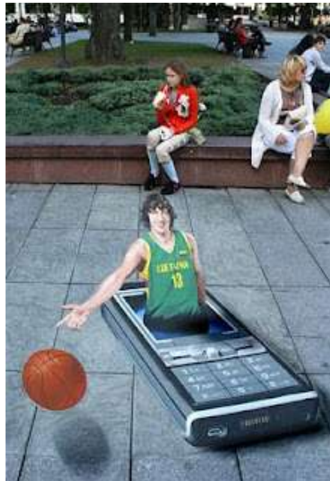
1 pav. 3D piešinys Vilniuje. 2006m.