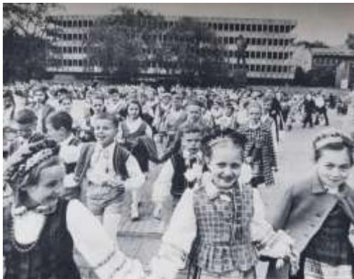
1pav. „Vaikai J. Janonio aikštėje Kaune“