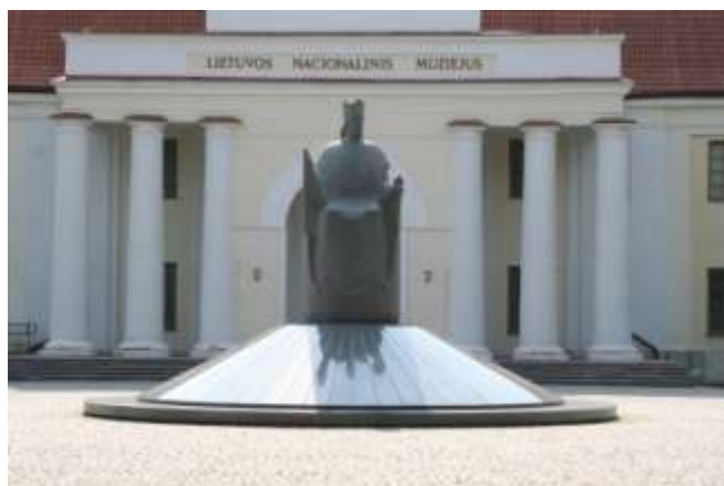
3pav. Paminklas Karaliui Mindaugui. 2003 m. Skulptorius R. Midvikis.