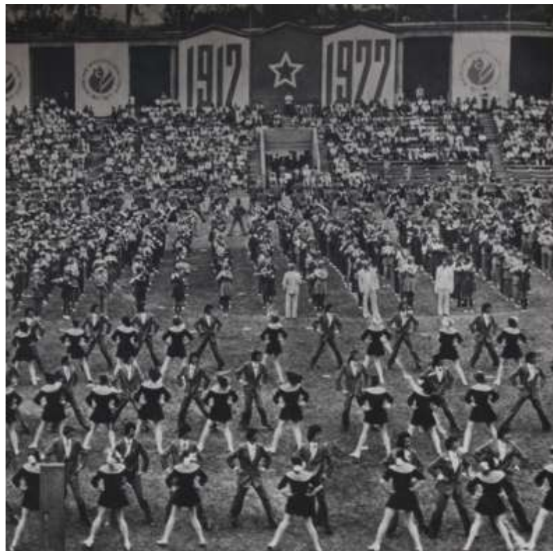
4pav. „Jubiliejinė respublikinė moksleivių dainų ir šokių šventė“