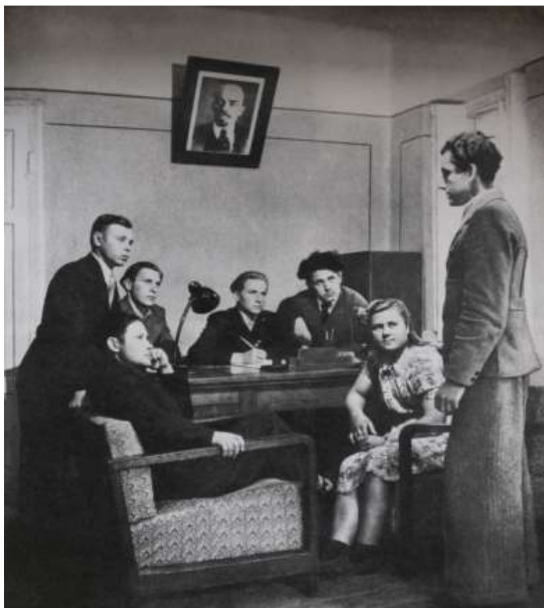
2 pav. 1950m. „Priėmimas į komjaunimą Pakruojo valsčiuje“ I. Fišeris