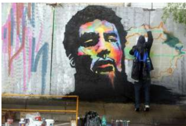
4pav. „1000mečio Graffiti“ 2009m.