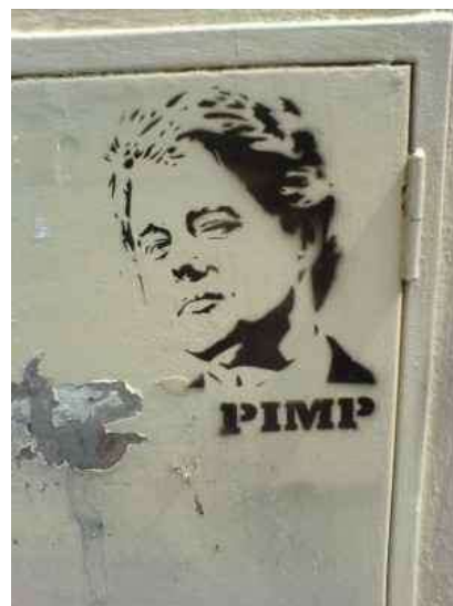
2pav. Bill Clinton