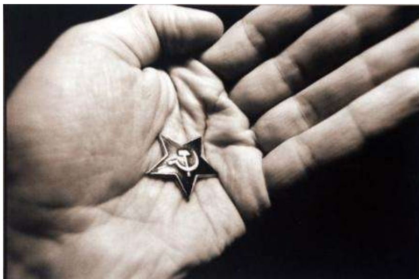
1 pav., „Ženklas“ A. Ostašenkovas