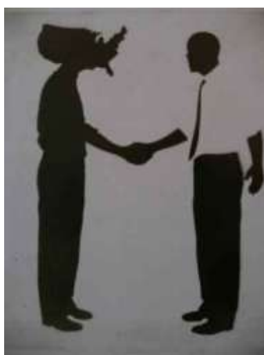
3pav. Jav prezidentas B. Obama