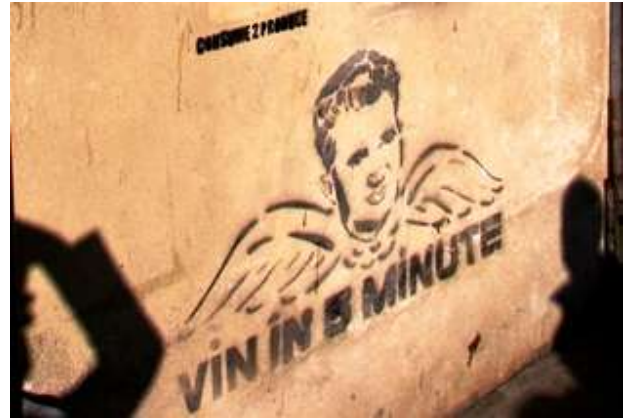
2pav.D. Gorzo „Vin in 5 minute“