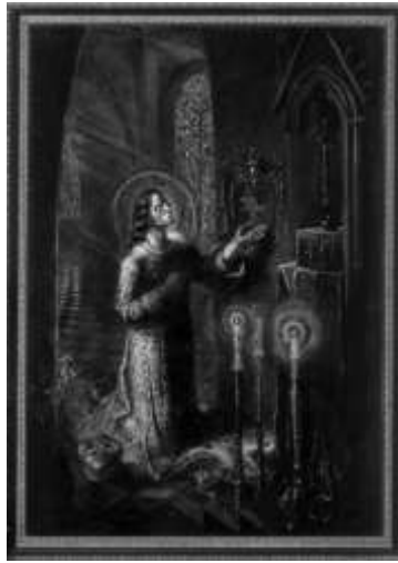
1pav. „Šv. Kazimieras atgailauja už Lietuvą“ 1943m. V.Kasiulis