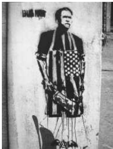
1pav. George Bush