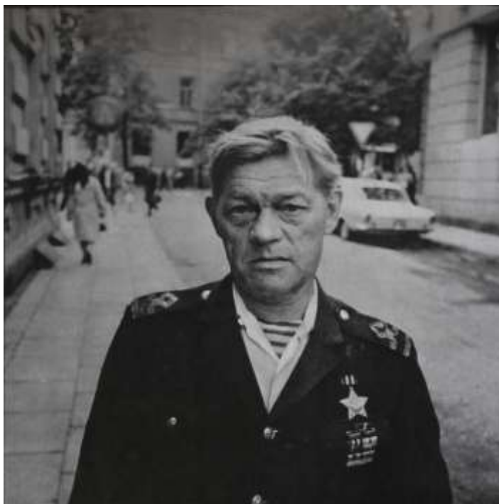
5pav. „Poetas P. Širvys“ iš ciklo „Lietuvos žmonės“