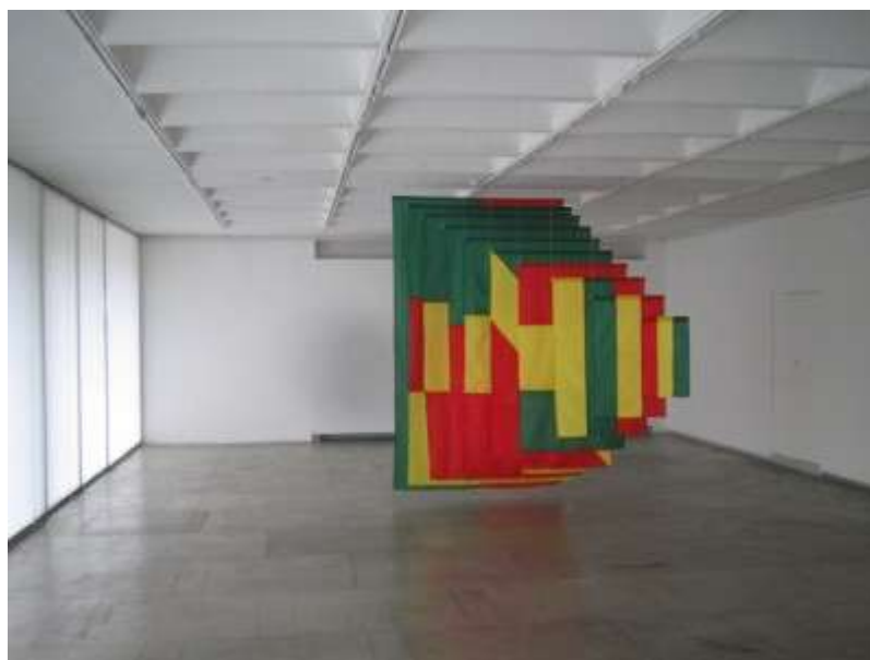
1 pav. Audrius Novickas „Trispalvės dėlionės“ 2005m. V.Balčytis