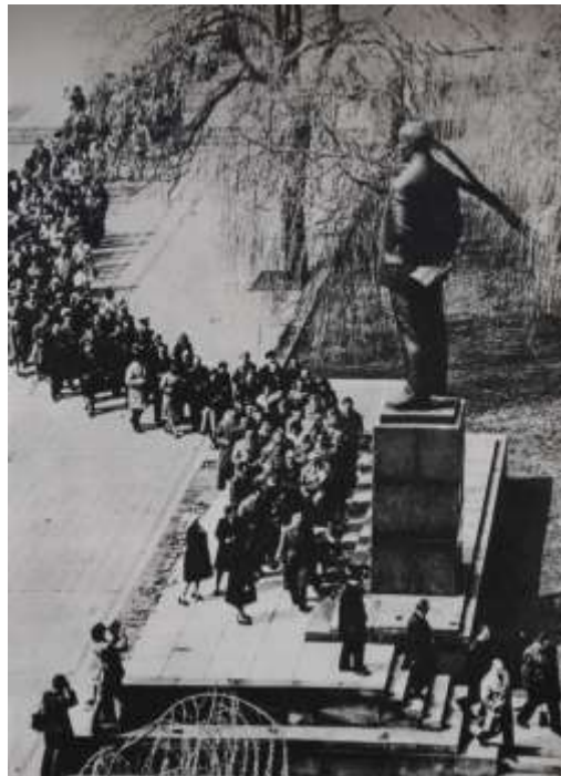
2pav. „Gėlės Leninui“