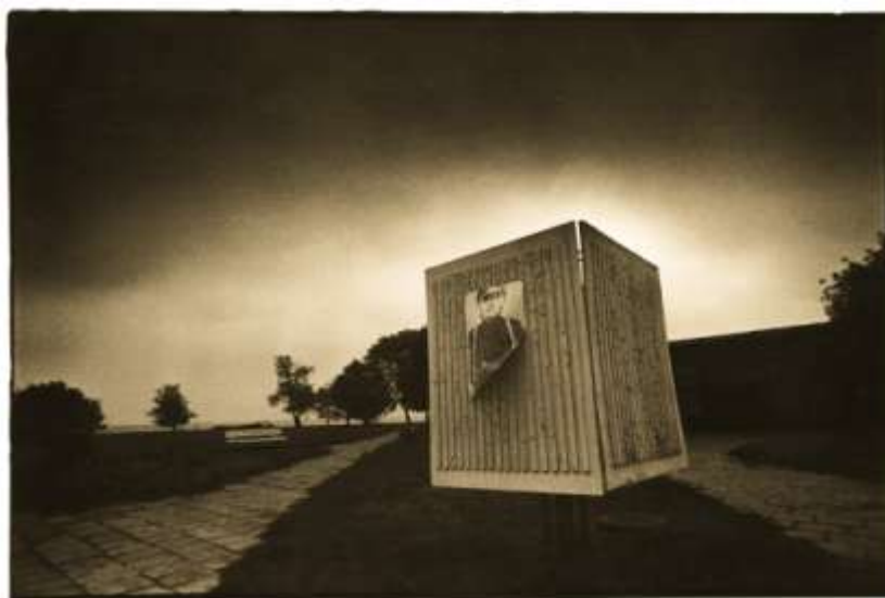
2 pav., „Diena jau praėjo“ A. Ostašenkovas