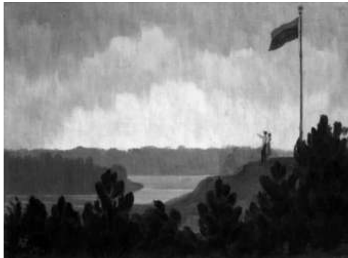
2pav. „Po Lietuvos vėliava“ 1942m. A. Žmuidzinavičius