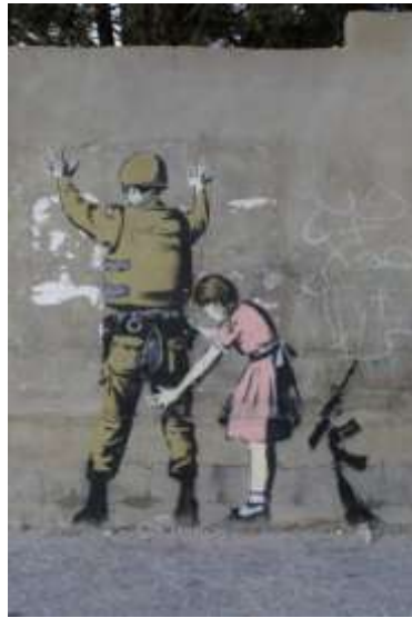
1pav., „Girl and a Soldier“