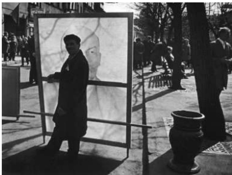
1 pav. Iš ciklo „Demonstracijos“ A. Macijauskas