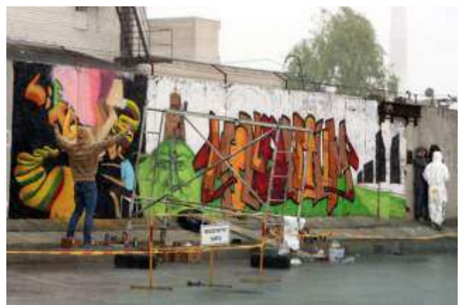
5pav. „1000mečio Graffiti“2009m.