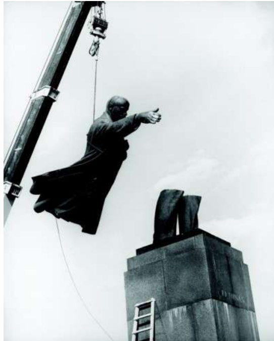
1pav. „Sudie, partijos draugai!“ 1991m. Antanas Sutkus