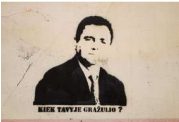
3pav.Gatvės menas Lietuvoje