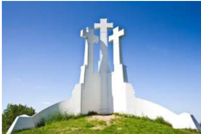
1pav. Trijų kryžių paminklas Vilniuje. A. Vivulskis.