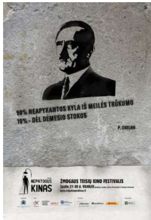
2-3 pav. Plakatas 2010m. festivaliui „Nepatogūs kinas“