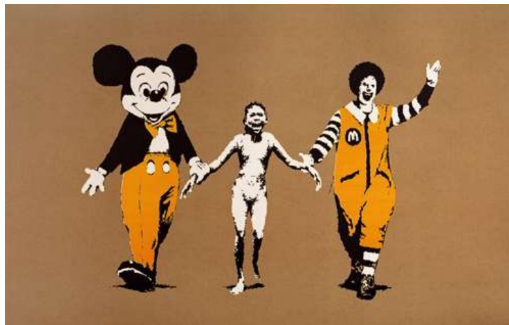
2pav. „Napalm“ 2004m.