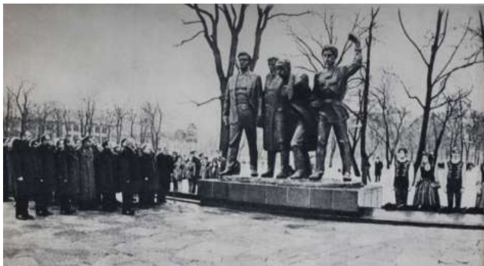
3pav. „Paminklo keturiems komunistams atidengimas Kaune“