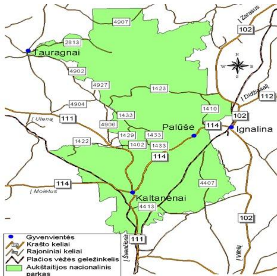
2 pav. ANP kelių ir geležinkelių schema