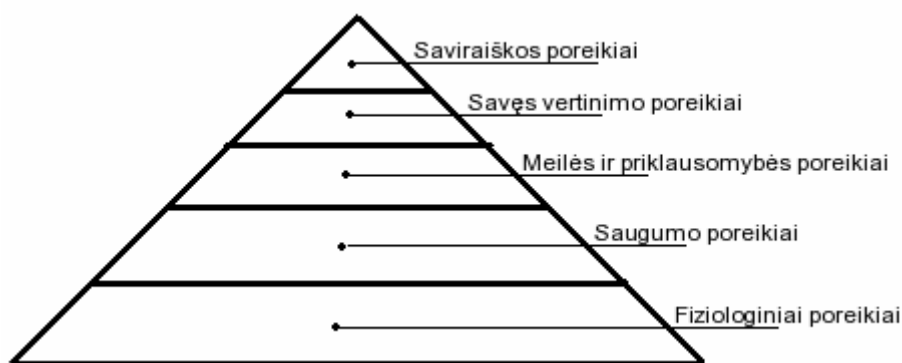
3 pav. A. Maslow žmogaus poreikių piramidė