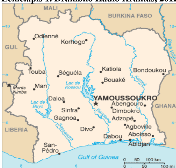
Žemėlapis 1. Dramblio Kaulo Krantas, 2012 7