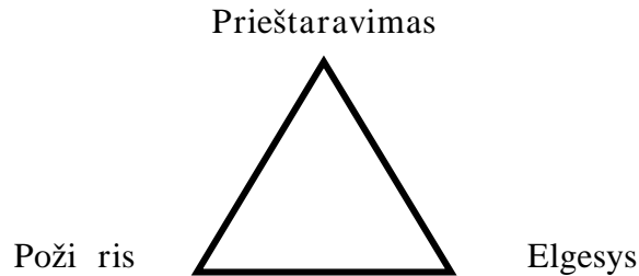
2 pav. J. Galtung konflikto smurto ir taikos modelis