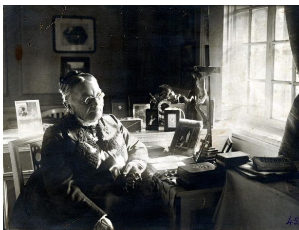
7) Sofijos Tiškevičienės (1839–1919) portretas

Mažas nuotraukų formatas, jų grupinis eksponavimas primena miniatiūrų eksponavimo ir saugojimo tradiciją. Dėl dydžio pastarosios užima neaiškią vietą meno istorijos studijose, jų vertinimas svyruoja nuo žanro marginalijos iki turinčių svarbią vietą Europos kultūros istorijoje 693 . Dėl savo specifinio dydžio miniatiūriniai portretai, kaip ir interjere eksponuojamos nuotraukos, šeiminkų atidžiai saugojami, jie eksponuojami matomoje vietoje, norint atidžiau įsižiūrėti, juos galima paleisti per rankas. Dėl saugumo ir estetinių priežasčių įremtos fotografijos, jų buvimas šeiminkui matomoje vietoje, jų priežiūra kaip miniatiūrų saugojimas po stiklu ar specialioje dėžutėje sufleruoja branginimą bei asmeninę reikšmę.