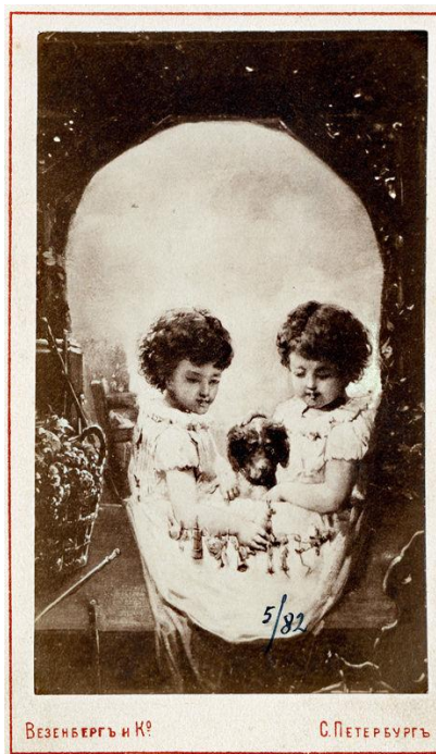
4) Dviejų mergaičių su šuniuku portretas, sudarantis kaukolės kompoziciją