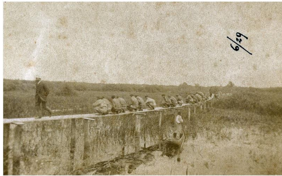
5 ir 6) Jaunos moters, pusiau gulomis sėdinčios šezlonge, portretas; Rusijos imperijos kareiviai ant liepto pelkėje.

Šį albumą vadinti visos šeimos albumu vargu ar galima, mat keletas jame įklijuotų nuotraukų yra perdėm anomališkos, gana asmeniškios, iškrentančios iš minėto šeimos albumų konteksto. Albume saugoma apskritai ir viena keisčiausių Kretingos muziejaus nuotraukų, kurioje nežinomas fotografas įamžino, kaip Rusijos imperijos kareiviai sutūpę ant liepto pelkėje atlieka gamtinius reikalus (KM IF 7063). XIX a. pab. nuotraukų, kuriose įamžinti kareivių ir karininkų portretai, yra nemažai. Jaunuolių portretai iš kariuomenės laikų buvo šeimos pasididžiavimo objektas, ypač jei karinė prievolė ar tarnyba atlikta nacionalinėje kariuomenėje. Tačiau daugelyje tokių portretų fotografuojamieji įamžinti labai standartiškai: pasitempę arba, priešingai, lyg išgirdę komandą „ramiai“, nuleidę ranką ant kardo rankenos ar kokio kito fotoateljė objekto. Tokiomis pozomis įamžinti tiek individai, tiek karininkų grupės, kurso ar būrio draugai. Kartais karininkų grupės buvo fotografuojamos vykdančios kokią nors jiems paskirtą užduotį 686 .