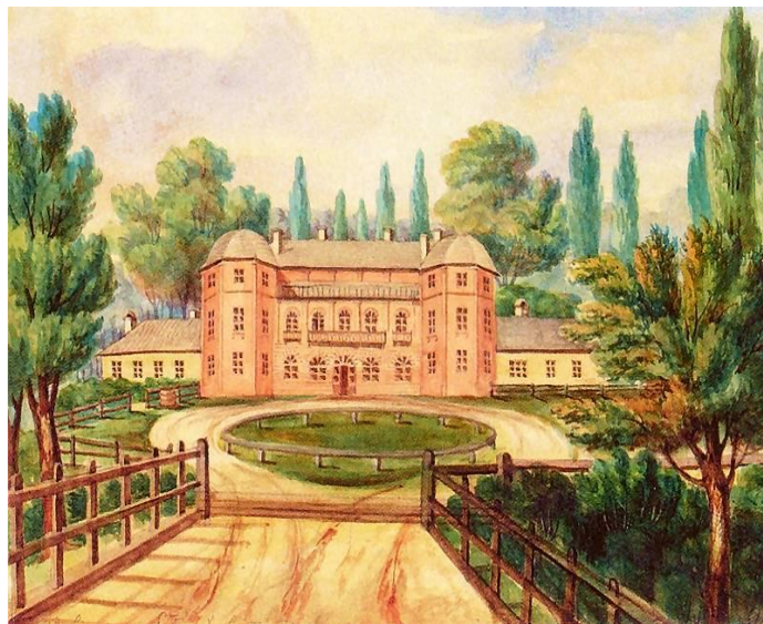
Gardino karališkoji medicinos mokykla, Ordos piešta 1861-aisiais – metu, kuomet pastatas priklausė didikams Czetwertyńskiams ( Napoleonas Orda: Senosios Lietuvos architektūros peizažai, op. cit., p. 64 ).

turėjo derėti ne tik prie senojo Gardino statinių, bet ir prie gamtos. Apskritai Apšvietos epochai buvo būdinga nuostata, kad architektūra turi glaudų ryšį su gamta - prisitaiko prie gamtos ir iš jos mokosi. Tikėta, kad kai kurie gamtiniai aspektai įtakoja architektūrinį vystymąsi, kad gamta architektūroje yra kaip kūrybinė metamorfozė, kad architektūra transformuoja gamtą ir tuo pačiu pati transformuojasi. Paisant minėtos nuostatos, Gardino karališkoji medicinos mokykla statyta išlakių medžių paunksmėje, prie pat botanikos sodo, teatras,