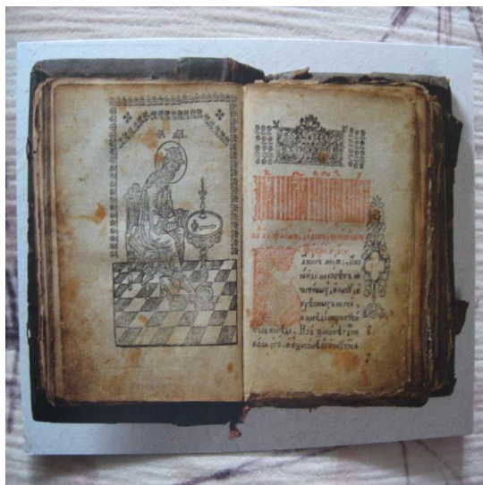
Псалтырь, Гродно: в типографии гроденской, 1795 (НББ, ОФХ-12РК28489).

Iš viso Gardino spaustuvėje buvo perleista apie 30 įvairių religinio-didaktinio (daugiausia senųjų, iki Nikono reformų publikuotų) bei poleminio pobūdžio sentikių tekstų. 414 Spausdinti psalmynai, triodai, horologinai (bažnytinių valandų knygos), bažnyčios