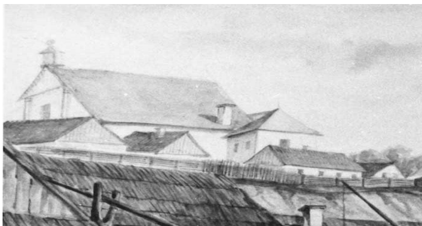
Ordos pavaizduota Gardino didžioji (choralinė) sinagoga.

Daugiakultūris LDK tradicijos formas analizuojančiose studijose pažymima, kad LDK miestai išsiskyrė tolerancija ir pagarba, rodoma įvairioms konfesijoms. Su tam tikromis išlygomis pritarę šiai nuostatai (pvz., Maimono Gyvenimo istorijoje pateikti liudijimai verčia abejoti tokiu pakantumu; žr. p. 163), savitu pagarbos ženklu kitatikiams laikytume ir Gardino mieste didžiajai