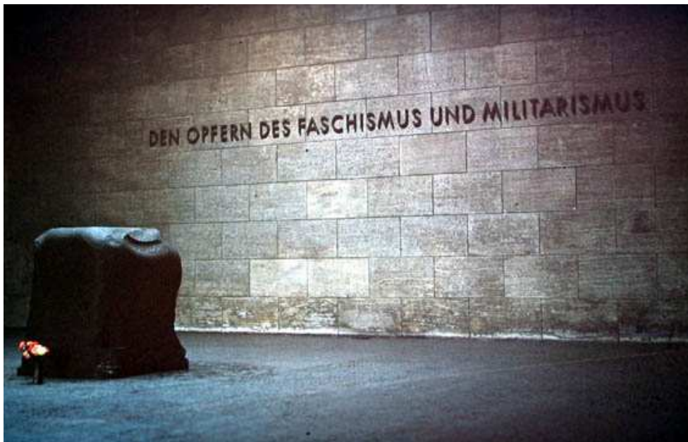
Nr.1 Neue Wache (Berlynas)

Šalia kolektyvinės aukos įvaizdžio, šių dienų paminklas turi atlikti ir visiškai naują, neįsivaizduojamą iki XX a. antros pusės vaidmenį – kolektyvinės atsakomybės jausmą. Vienas iš pavyzdžių, charakterizuojančių slinktį nuo herojinio iki „antiherojinio“ paminklo yra Neue Wache memorialas Berlyne. Friedrich'as Schinkel'is 1816-1818 m. suprojektavo pastatą-paminklą prūsų karinių dalinių pergalei prieš Napoleoną atminti. 1993 m. tuometinio Vokietijos kanclerio H. Kohl'io sprendimu buvo nutarta šiame pastate įkurti memorialą, skirtą fašizmo ir militarizmo aukoms. 44 (žr. nuotraukas nr. 1, 2, 3) Tokiu būdu, Vokietija tampa viena iš pavyzdžių kaip tautos paminklais turi reprezentuoti ne tik savo šlovės bet ir „gėdinguosius“ istorijos laikotarpius.