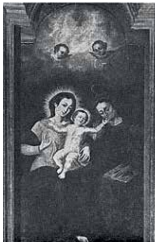
120. Šv. Ona, pati trečioji. XVII a. II p. Kosztowo parapiinė bažnyčia (Lenkija).