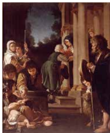
144. Šv. Joakimo ir šv. Onos susitikimas prie Aukso vartų. Bartolomeo Schedoni (1578–1615) paveikslo kopija. LDM.