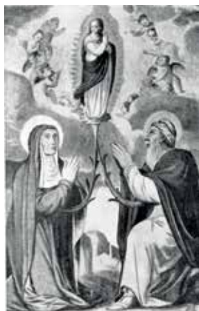
18. Arbor Virginis . XVIII a. Dail. Vejer de la Frontera. Privati nuosavybė.