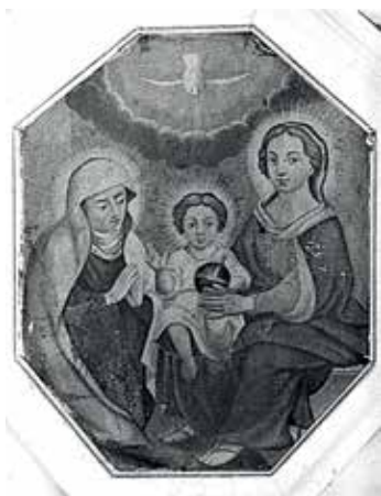
85. Šv. Ona, pati trečioji. XVIII a. II p. Paveikslas, buvęs Riečių bažnyčioje.