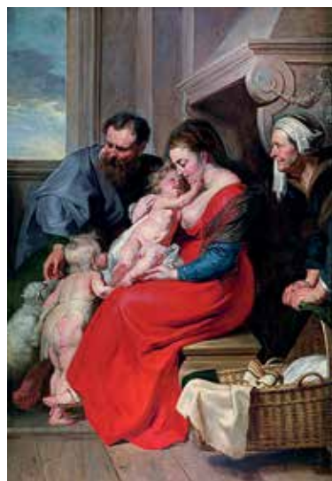
98. Šv. Onos Šeima. P. P. Rubenso (1577–1640) dirbtuvė.