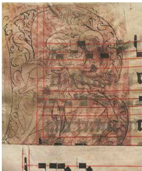
55. Inicialas „B“. XVI a. pab. – XVII a. pr. Bažnytinis giesmynas. LMAVB RS.