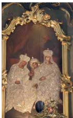
123. Šv. Ona, pati trečioji. XVIII a. vid. (apie 1743–1762 m.). Vilniaus Šv. Onos bažnyčios didžiojo altoriaus paveikslas.