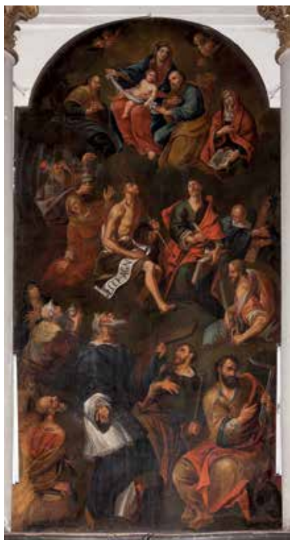
140. Šventieji garbina Šv. Šeimą. Apie 1690 m. Dail. Johanas Gothardas Berghofas.