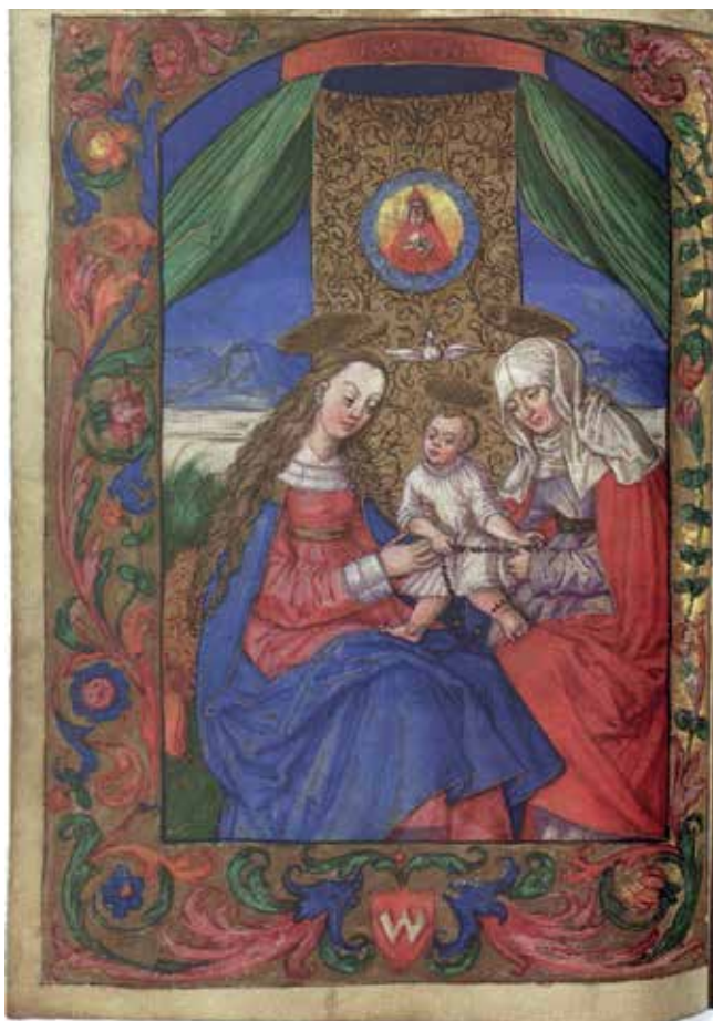
48. Šv. Ona, pati trečioji. 1528 m. Dail. Stanislovas Samostrzelnikas. Iliuminacija iš Alberto Goštauto valandų knygos.