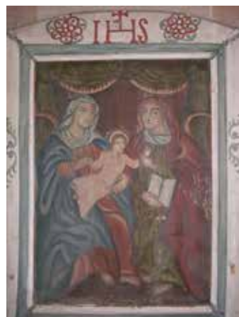
57. Šv. Ona, pati trečioji. Apie 1772 m. Altorinis paveikslas iš Geidžių Šv. Onos koplyčios. Telšių „Alkos“ muziejus.