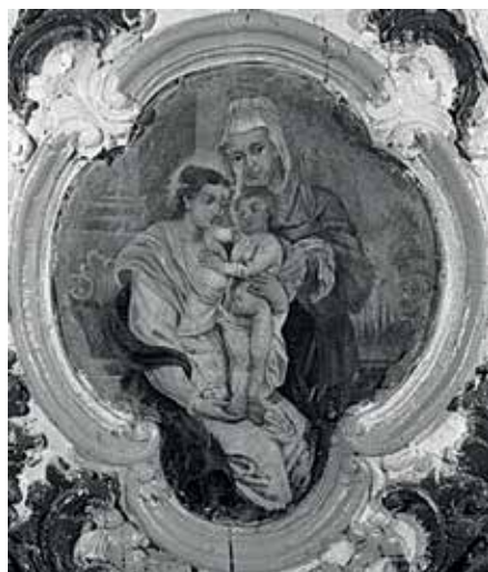
94. Šv. Ona, pati trečioji. Apie 1760–1770 m. Paveikslas iš Slanimo bernardinų Švč. Trejybės bažnyčios procesijų altorėlio. Lazdūnų bažnyčia.