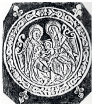
51. Šv. Ona, pati trečioji. Iki XVI a. 3 deš. Vilniaus knygrišių įrišto knygos viršelio įspaudas.