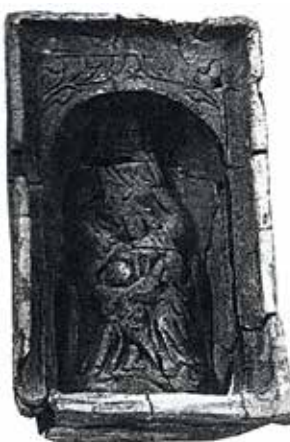
41. Šv. Ona, pati trečioji. XV–XVI a. sandūra – XVI a. pr. Neglazūruotas lovinis koklis iš Kauno senamiesčio. NČDM.