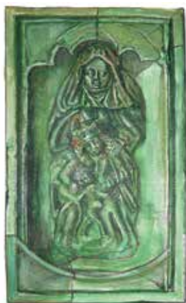
40. Šv. Ona, pati trečioji. XV a. pab. – XVI a. pr. koklio iš Vilniaus miestiečio interjero rekonstrukcija. Dail. Jonas Petuchovas. LNM.