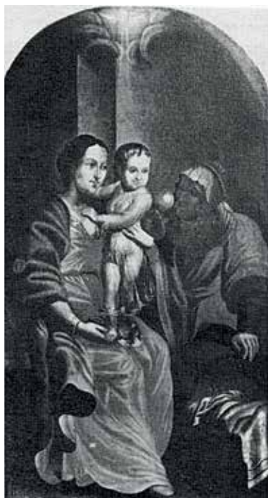
93. Šv. Ona, pati trečioji. XVIII a. pr. Drohičino (Palenké) Švč. M. Marijos Ėmimo į dangų bažnyčia. Altorinis paveikslas, atvežtas iš Sady bažnyčios.