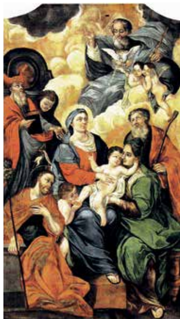
138. Šv. Onos Šeima. XVIII a. Gardino (?) r.