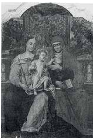
64. Šv. Ona, pati trečioji. XVI a. pab. Krokuvos norbertiečių vienuolynas.