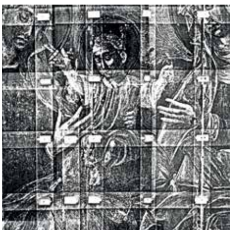
62. Šv. Onos šeima. XVI a. II p.–XVII a. I p. Rūdninkų bažnyčia. Rentgeno nuotrauka.