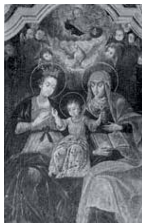
65. Šv. Ona, pati trečioji. 1656 ir 1707 m. Krosno parapiinė bažnyčia (Lenkija).