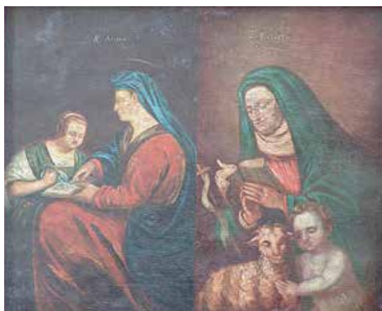
166. Švč. Mergelės Marijos auklėjimas. Šv. Elžbieta ir šv. Jonas Krikštytojas. XIX a. I p. Tytuvėnų bernardinų bažnyčios nešiojamas paveikslas (neiškilo).