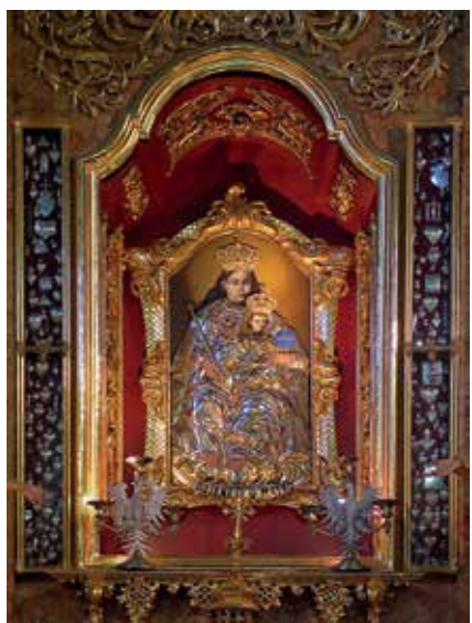
73. Švč. M. Marija su Vaikeliu. XVII a. Kalwarya Paclawska Kristaus Kančios ir Kalvarijos Dievo Motinos bažnyčia (Lenkija).