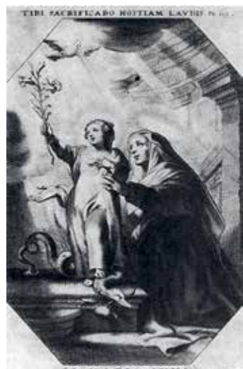
28. Švč. M. Marija Nekaltai Pradėtoji su šv. Ona. XVII a. Dail. Cornelis Galle. Medžio raiziny.