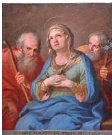
141. Šv. Ona su šv. Joakimu ir šv. Juozapu. XVIII a. 7–8 deš. Dail. Simonas Čechavičius (?). Tabariškių bažnyčia.