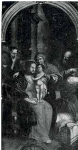
96. Šv. Onos Šeima. 1694 m. Liubartowo (Lenkija) bažnyčia.