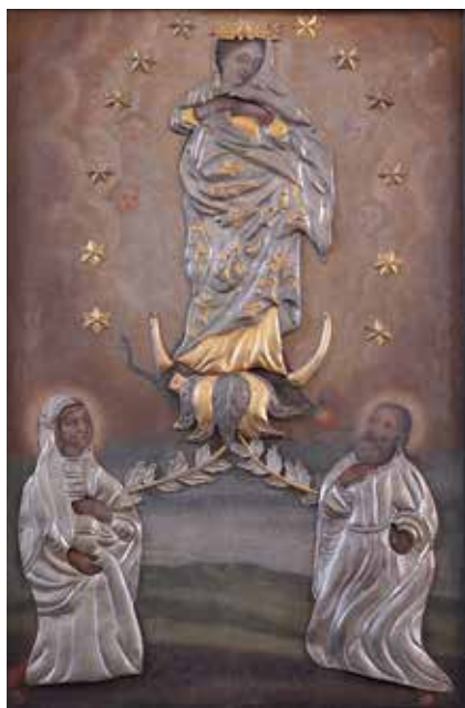
150. Arbor Virginis . XVIII a I p. Aptaisai – XVIII a. IV ketv. / XIX a. I ketv. Kriaunų Dievo Apvaizdos bažnyčia.