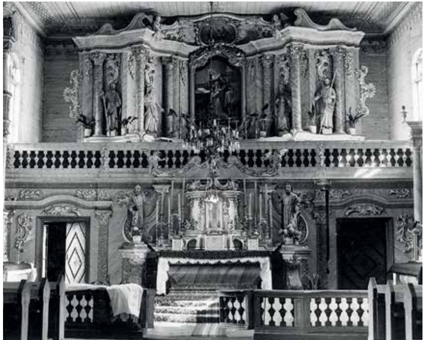
37. Batakių bažnyčios didysis altorius su dengiamu paveikslu (neiškilo).