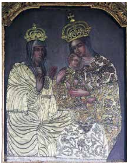
74. Šv. Ona, pati trečioji. XVII a. Aptaisai – XVII a. pask. ketv. – XIX a. I p. Karūnos – XVII a. II p. Buvęs Kražių benediktinių bažnyčioje, dabar – Maironių bažnyčios altorinis paveikslas.