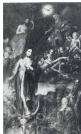
27. Švč. M. Marija Nekaltai Pradėtoji. XVIII a. I ketv. Pienižno Šv. Petro ir Povilo bažnyčia (Lenkija).