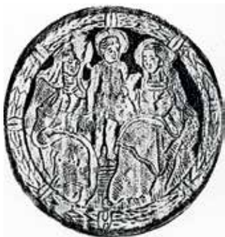
50. Šv. Ona, pati trečioji. Iki XVI a. 4 deš. Vilniaus knygrišių įrišto knygos viršelio įspaudas.