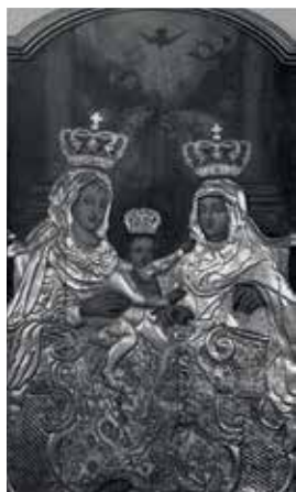
101. Šv. Ona, pati trečioji. XVIII a. II p. / 1929 m. Aptaisai – XVIII a. pab. Slanimo bernardinų bažnyčia.