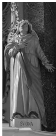
189. Šv. Onos skulptūra. XVIII a. II p. Sedos bažnyčia.