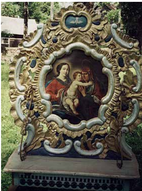
118. Šv. Ona, pati trečioji. XVIII a. IV ketv. Dail. Stanislovas Dalmontas. Pavandenės bažnyčios procesijų altorėlio paveikslas.