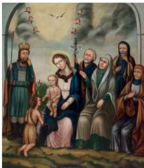
139. Šv. Onos Šeima. XIX a. Paveikslas, buvęs Notėnų bažnyčioje. LDM