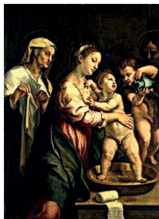
25. Šv. Ona padeda maudyti kūdikėlį Jėzų. Apie 1525 m. Dail. Giulio Romano. Drezdeno galerija.