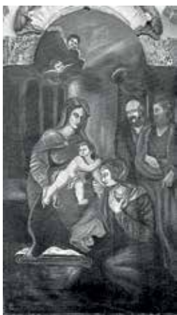
131. Šv. Onos Šeima. XVIII a. / XX a. Yvijos bernardinų bažnyčia.