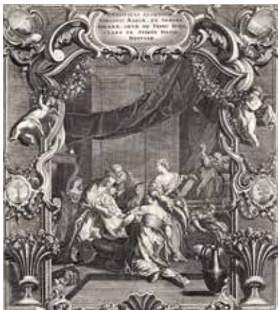
21. Švč. Mergelės Marijos gimimas. XVIII a. Atspaudė Johann Gottfried Thelott, raižytojas Tobias Lobeck. LDM.