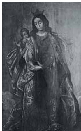
59. Švč. Mergelė Marija Nugalėtoji. XVI a. II p. – XVII a. (?). Rūdinkų bažnyčia.