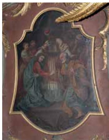
178. Švč. Mergelės Marijos ir šv. Juozapo sužadėtuvės. XVIII a. vid. Vilniaus Šv. Jurgio kankinio bažnyčia.