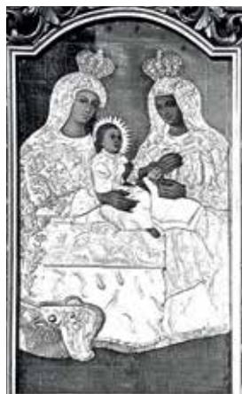
111. Šv. Ona, pati trečioji. 1818 m. Aptaisai: XVIII a. III ketv.–1818 m. Pasvalio bažnyčia.