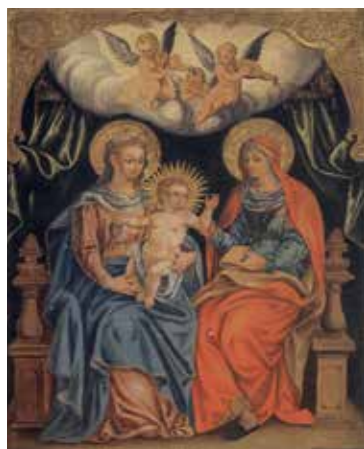
69. Šv. Ona, pati trečioji. 1610 m. Kamienna Stara bažnyčia (Lenkija).