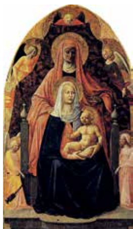
7. Šv. Ona, pati trečioji. 1424 m. Dail. Masacci, Masolino da Panicali. Uffizi, Florencija.