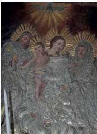
133. Šv. Onos Šeima. XVII a. I p. / XVIII a. vid. Dail. J. Kunickis (?). Alsėdžių bažnyčia.