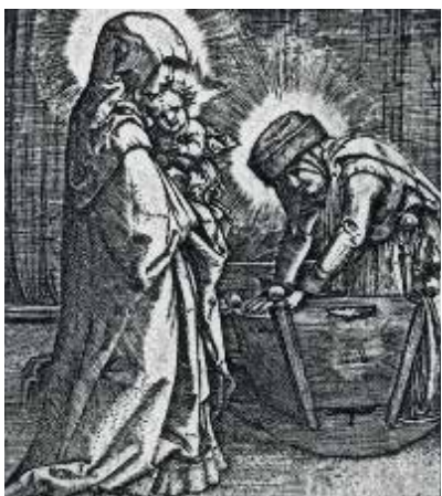
24. Šv. Ona kloja Jėzaus lopšį. 1506–1538 m. Dail. Albrecht Altdorfer. Amsterdamas, Rijksmuseum.