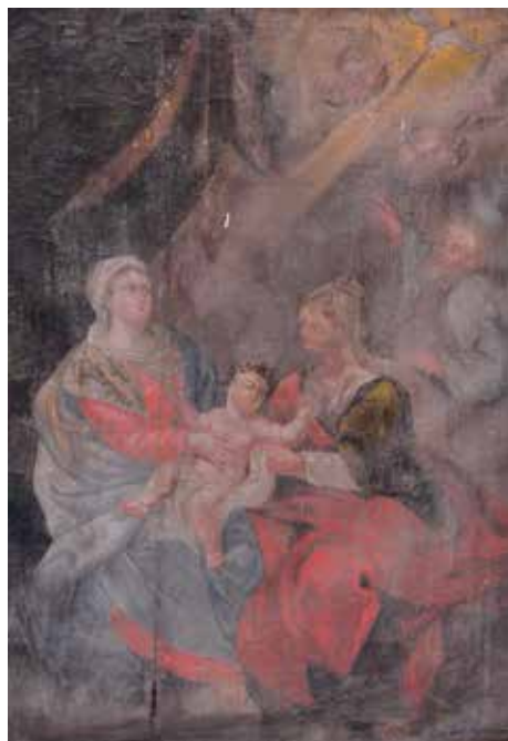
134. Šv. Onos Šeima. XVIII a. II p. Tabariškių bažnyčia.