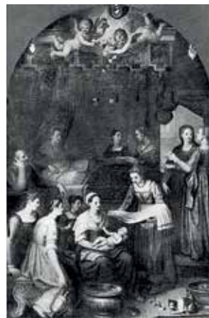
22. Švč. Mergelės Marijos gimimas. 1598 m. Dail. Francesco Curadi. Volterros katedra (Italija).