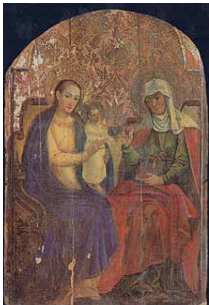
71. Šv. Ona, pati trečioji. XVI–XVII a. Javorivo bažnyčia.