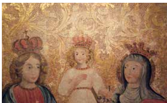
68. Šv. Ona, pati trečioji. XVII a. IV ketv. Paveikslas fragmentas.