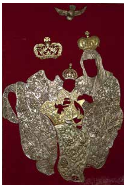
81–82. Šv. Ona, pati trečioji. XVII a. 3 deš. Tytuvėnų bažnyčios altorinis paveikslas ir jo aptaisai (XVIII a. vid.).