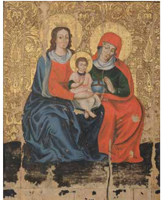
78. Švč. Mergelė Marija su Vaikeliu (Čenstakavos Švč. Mergelė Marija). XVII a. II–III ketv. Merkinės bažnyčia.