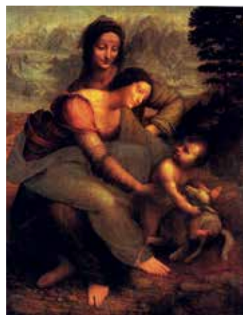
8. Šv. Ona, pati trečioji. 1515 m. Dail. Leonardo da Vinci. Luvras.