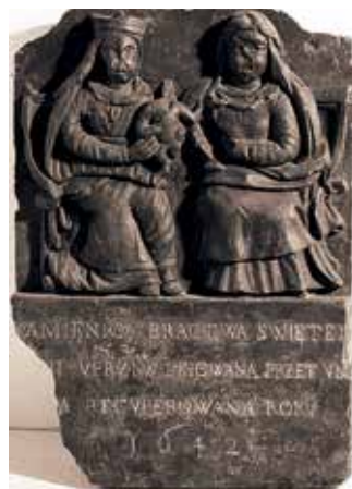
80. Vilniaus Šv. Onos brolijos namų iškaba. 1642 m. LNM.