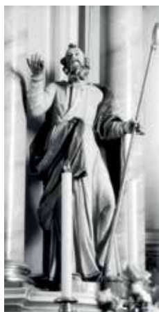
152. Šv. Joakimo skulptūra. 1767–1769 m. Prienu bažnyčia.