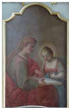
163. Švč. Mergelės Marijos auklėjimas. XVIII a. III ketv. Vilniaus buvusi jėzuitų Šv. Arkangelo Rapolo bažnyčia.