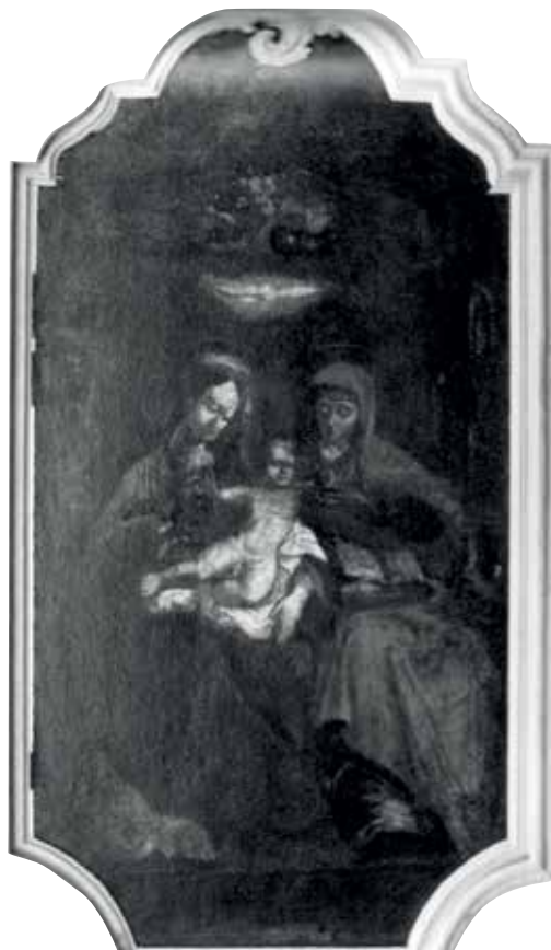
53. Šv. Ona, pati trečioji. XVII a. I ketv. Altorinis paveikslas iš Mežirečės bažnyčios. Gardino religijos istorijos muziejus.