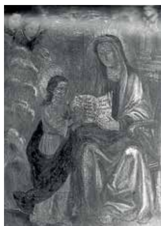
171. Švč. Mergelės Marijos auklėjimas. Iki 1786 m. Kiemeliškių parapinė bažnyčia.