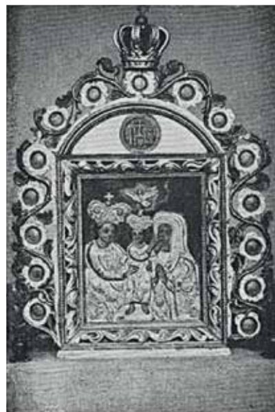
88. Procesijų altorėlis iš Rumšiškių bažnyčios. KAM.