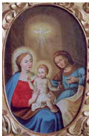
109. Šv. Ona, pati trečioji. 1797–1798 m. Pivašiūnų bažnyčia. Procesijų altorėlio paveikslas.