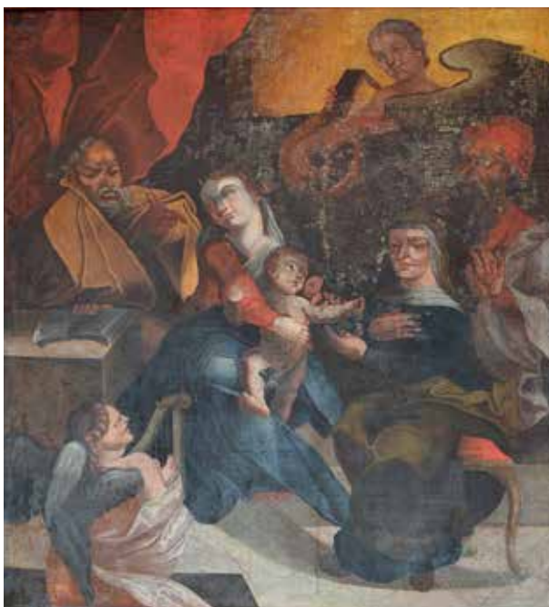
108. Šv. Onos šeima. XVIII a. pr. Dotnuvos bažnyčia.