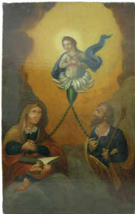
136. Arbor Virginis . XVIII a. pab.–XIX a. pr. Procesijų altorėlio paveikslas iš Kaunatavos bažnyčios. Kretingos muziejus.