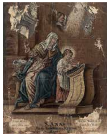
168. Švč. Mergelės Marijos auklėjimas. XVIII a. pab. Než. vokiečių dailininkas. Paspalvinta graviūra. LDM