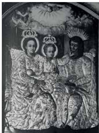
127. Šv. Ona, pati trečioji. XVII a. II p. Aptaisai: auks. Johann Gottlieb Rhode, 1756 m. Gniewkowo bažnyčia (Lenkija).