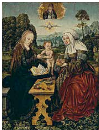
11. Šv. Ona, pati trečioji. 1509 m. Frankfurto dirbtuvės meistras. Heidelbergo miesto muziejus.