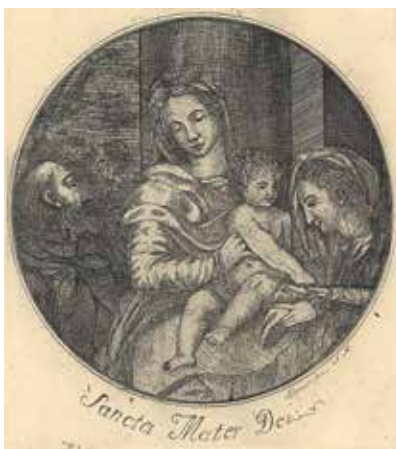
135. Šv. Onos Šeima. XVIII a. pab. Dail. Jonas Nikodemus Lopacinskis. LDM