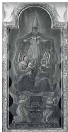
102. Šv. Ona, pati trečioji. XVIII a. pab.–XIX a. (?) Mikailiškių regulinių atgailos kanauninkų bažnyčios altorinis paveikslas (dingęs).