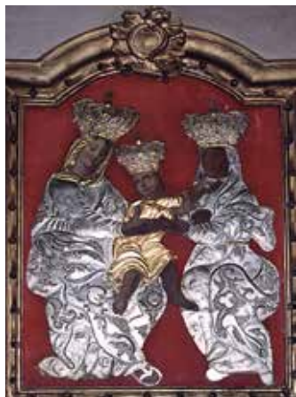
125. Šv. Ona, pati trečioji. XVIII a. III ketv. Dail. Jonas Kunickis (?). Platielių bažnyčios altorinis paveikslas.