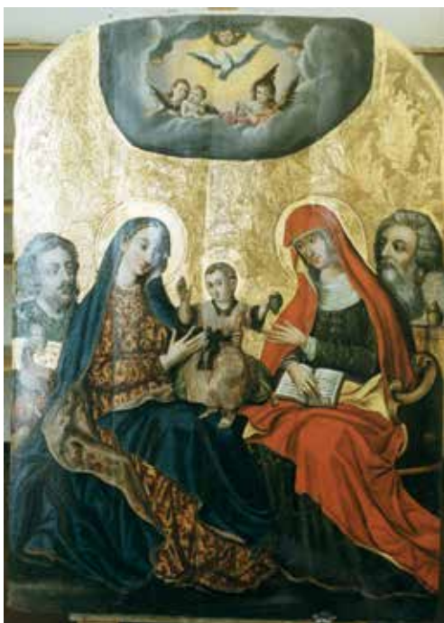
58. Šv. Onos Šeima. XVI a. II p.–XVII a. I p. Rūdinkų bažnyčia.