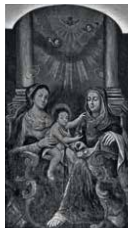
100. Šv. Ona, pati trečioji. XVIII a. II p. / 1929 m. Altorinis paveikslas iš Slanimo bernardinų bažnyčios.