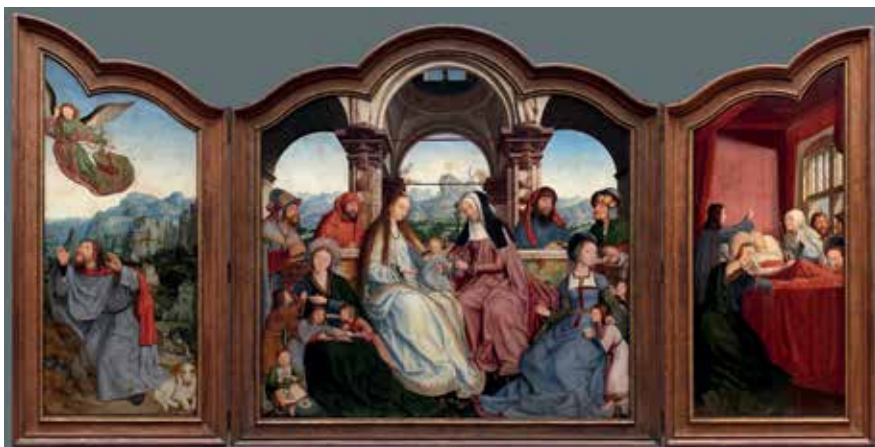
14. Šv. Onos altorius. 1507–1508 m. Dail. Quentin Massys. Musées Royaux des Beaux-Arts, Briuselis.