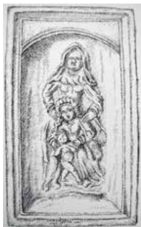
39. Šv. Ona, pati trečioji. XV a. pab. – XVI a. pr. koklis iš Vilniaus miestiečio interjero. LNM.