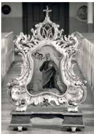
179. Nešiojamo altorėlio retabulas su paveikslais „Švč. M. Marijos Nekaltas Prasidėjimas“ ir „Šv. Ona“. XVIII a. III ketv. Krokialaukio bažnyčia.