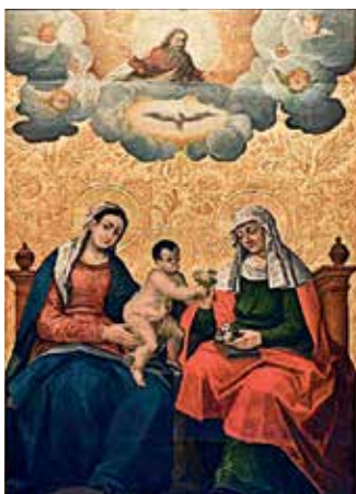
115. Šv. Ona, pati trečioji. XVII a. Altorinis paveikslas iš Stary Sącz Šv. Elžbietos Vengrės bažnyčios (Lenkija).