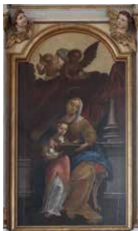
160. Švč. Mergelės Marijos auklėjimas. XVIII a. III ketv. (1751–1775 m.). Tryškių bažnyčios altorinis paveikslas.