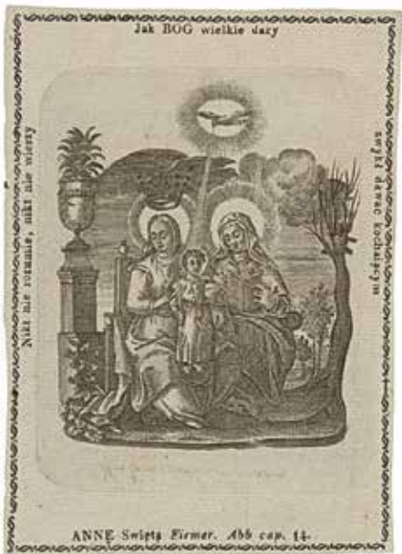
87. Šv. Ona, pati trečioji. XVIII a. pab. –XIX a. pr. Vario raizynis iš XIX a. Vilniaus Šv. Onos brolijos pažymėjimo. LMAVB RSS