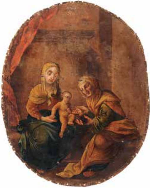
75. Šv. Ona, pati trečioji. XVIII a. II ketv. Paveikslas iš Surviliškio bažnyčios procesijų altorėlio. LNM.