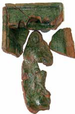
38. Šv. Ona, pati trečioji. XVI a. koklio rekonstrukcija. Vilniaus Žemutinė pilis. Dail. Alvyra Mizgiriene.