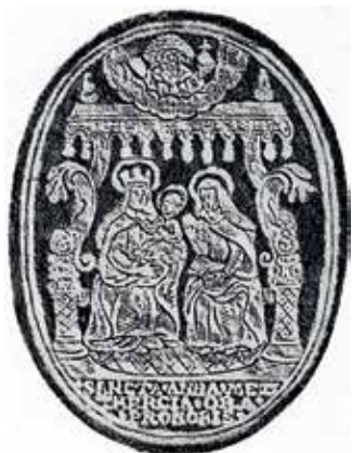
52. Šv. Ona, pati trečioji. XVII a. Vilniaus knygrišių įrišto knygos viršelio įspaudas.