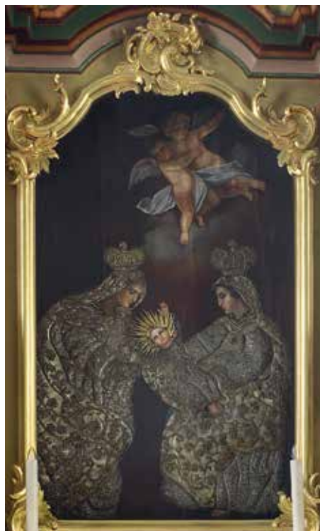
34. Šv. Ona, pati trečioji. XVII a. vid.–XVIII a. I p. Aptaisai: XVII a. pab.– XVIII a. pr. Prienuų bažnyčia.