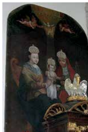
70. Šv. Ona, pati trečioji. XVII a. (?). Kazimierz Dolny bažnyčia.