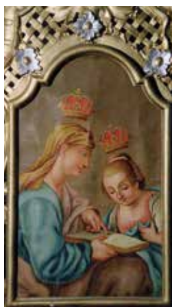
164. Švč. Mergelės Marijos auklėjimas. XVIII a. III ketv. Kiauklių bažnyčios altorėlio paveikslas.