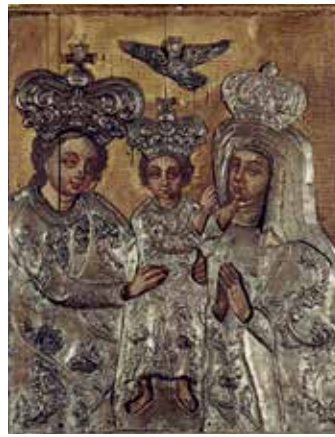
89–90. Šv. Ona, pati trečioji. XVII a. IV ketv. Aptaisas – XVIII a. 6-8 deš.–XVIII a. II p. Paveikslas iš Rumšiškių bažnyčioje buvusio atorėlio. KAM.