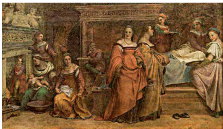
20. Švč. Mergelės Marijos gimimas. 1514 m. Dail. Andrea del Sarto. Freska Florencijos Švč. M. Marijos Apreiškimo bažnyčioje.