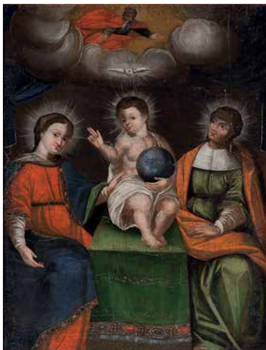
83. Šv. Ona, pati trečioji. XVII a. IV ketv. Vilniaus Visų Šventųjų bažnyčia.