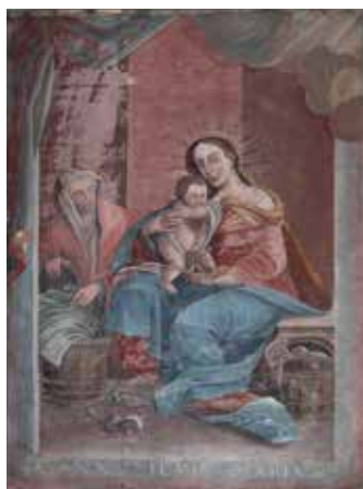
99. Šv. Ona, pati trečioji. Apie 1817 m. Pavandenės bažnyčia.