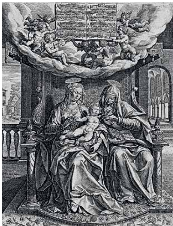
54. Šv. Ona, pati trečioji. XVI a. pab. Johann Sadeler graviūrą pagal Marten de Vos 1584 m. piešinį.