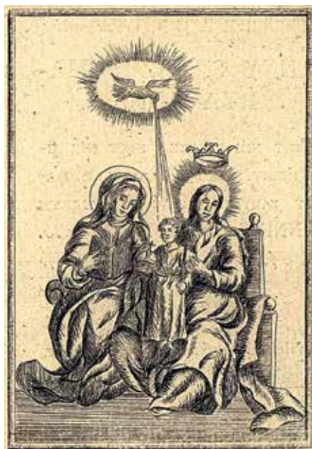
86. Šv. Ona, pati trečioji. XVIII a. pab. Vario raižinys. LDM