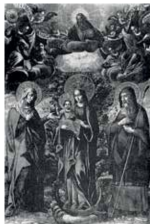
29. Tota pulchra . XVII a. I p. Krokuvos Šv. Petro ir Povilo bažnyčia.