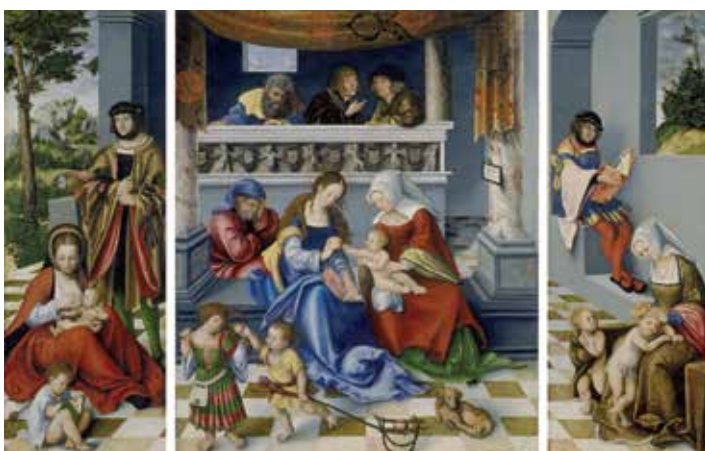
15. Torgauer altorius. 1509 m. Dail. Lukas Kranachas Vyresnysis. Städelsches Kunstinstitut, Frankfurtas prie Maino.