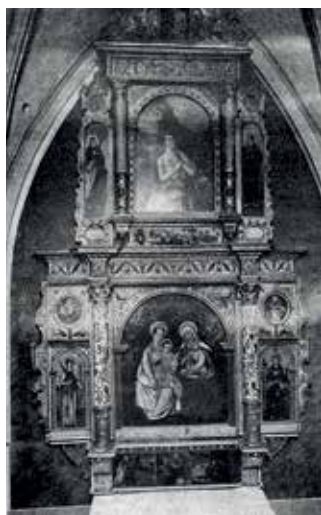
66. Šv. Onos altorius. 1589 m. Skelivka (Felsztyn) bažnyčia (Ukraina).