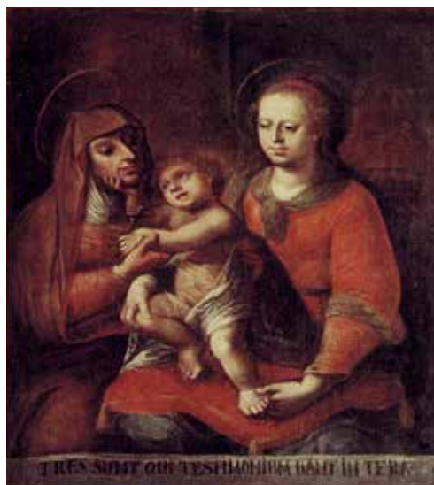
116. Šv. Ona, pati trečioji (neiškilo). XVIII a. vid. Procesijų altorėlio paveikslas. Paštuvos bažnyčia.