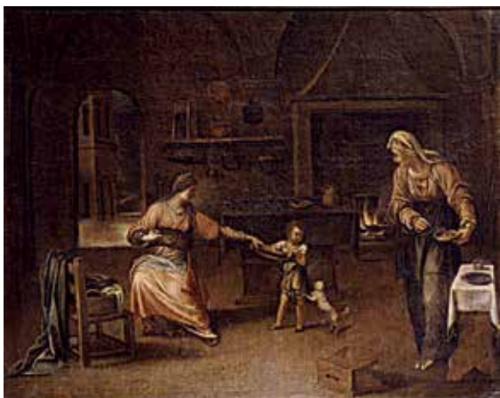
23. Šv. Ona moko Jėzų vaikščioti. Apie 1610–1620 m. Dail. Talpino (Enea Salmeggia). Bergamas, Academia Carrara.