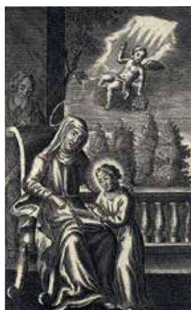
169. Švč. Mergelės Marijos auklėjimas. XVIII a. pab. LDM