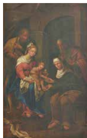
130. Šv. Onos Šeima. XVIII a. II p. (?) / 1876 m. Dotnuvos bažnyčia.