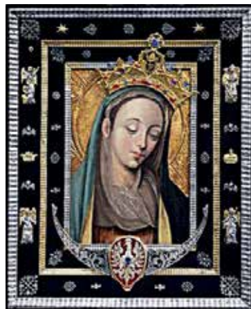
72. Kantriai klausančioji Dievo Motina. XVI a. pr. Rokitno Dievo Motinos bazilika (Lenkija).