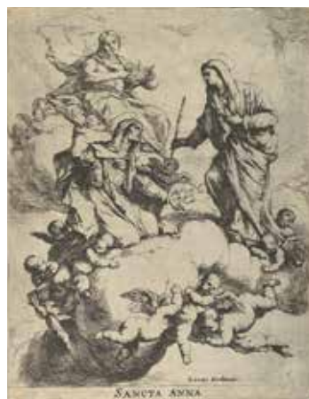
32. Kristus karūnuoja, o Švč. M. Marija pasitinka šv. Oną danguje. 1650–70 m. Dail. Luca Giordano. Raižinys. The Metropolitan Museum of Art, Niujorkas.