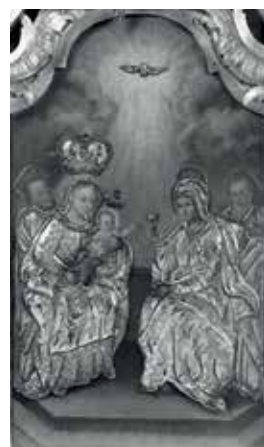
128. Šv. Onos Šeima. XVIII a. III ketv. Paveikslas iš procesijų altorėlio. Mikailiškių regulinių atgailos kanauninkų bažnyčia.