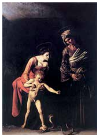
12. Madona su gyvate. 1605 m. Dail. Michelangelo Merisi da Caravaggio. Bordžijų galerija Romoje.