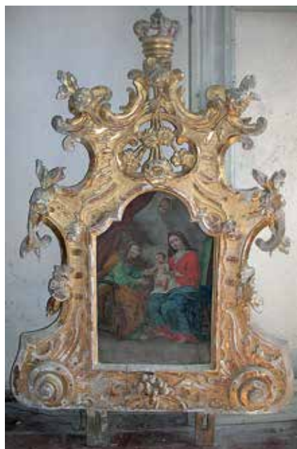
121. Tytuvėnų bažnyčios procesijų altorėlio retabulas su paveikslu „Šv. Ona, pati trečioji“ (neiškilo). XVIII a. III ketv.