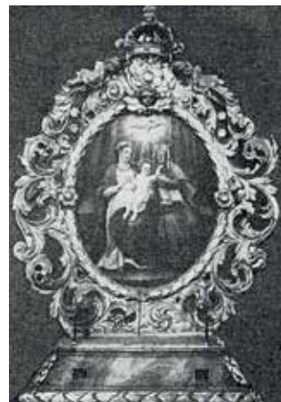
126. Šv. Ona, pati trečioji. XVIII a. pr. Paveikslas iš procesijų altorėlio. Chelmžos buvusi katedra (Lenkija).