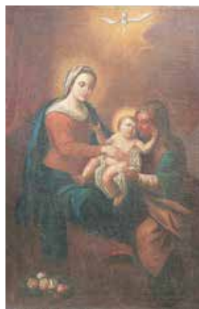
110. Šv. Ona, pati trečioji. XVIII a. IV ketv. Mielagėnų bažnyčia (anksčiau buvo Švenčionių bažnyčioje).