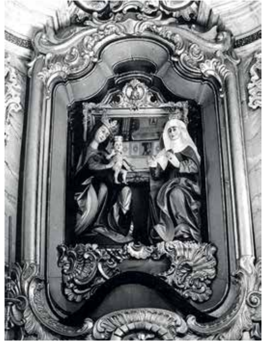
36. Šv. Ona, pati trečioji (neiškilo). XVI a. 1–2 deš. Batakių Šv. Onos bažnyčia.