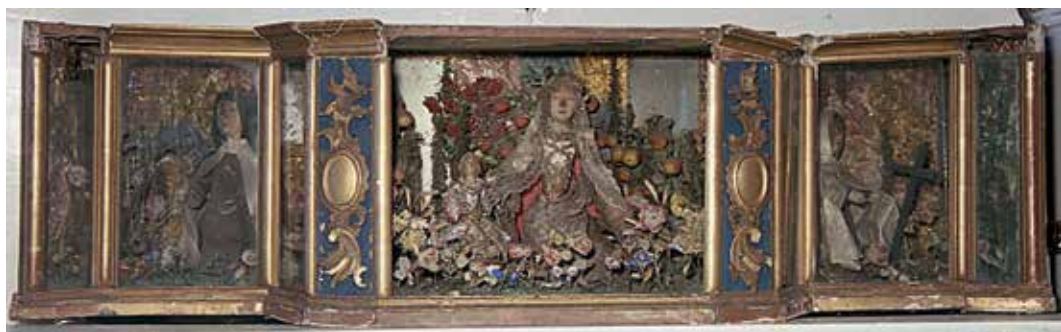
172. Labanoro bažnyčios devocinė kompozicija (neiškliko). XVIII a.