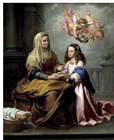
30. Švč. Mergelės Marijos auklėjimas. Dail. Bartolome Esteban Murillo (1617/1618–1682). Museo del Prado, Madridas.