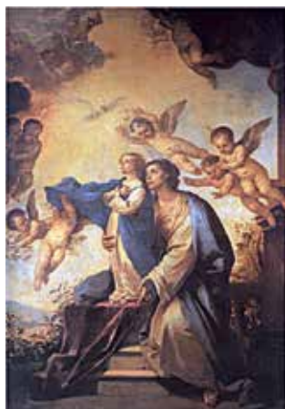
33. Šv. Ona su mergaite Švč. M. Marija. 1657 m. Dail. Luca Giordano. Paveikslas iš Neapolio Švč. M. Marijos Ėmimo į dangų bažnyčios.