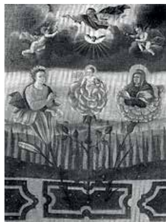
153. Šv. Šeimos alegorija. 1720–1730 m. Gardino brigitiečių bažnyčia.