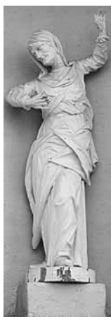
184. Šv. Onos skulptūra. XVIII a. III ketv. Vilniaus Visų Šventųjų bažnyčia.