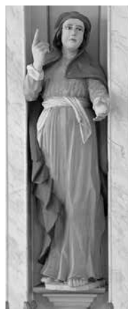
192. Šv. Onos skulptūra. XVIII a. IV kv. Tryškių bažnyčia.