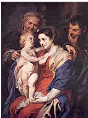
95. Šv. Onos Šeima. 1624 m. Dail. Peter Paul Rubens. Prado muziejus Madride.