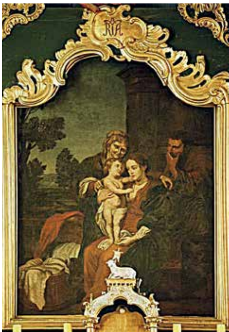
97. Šv. Onos Šeima. XVII a. II p. (?). Niewodna (Lenkija) Šv. Onos bažnyčios didžiojo altoriaus paveikslas.