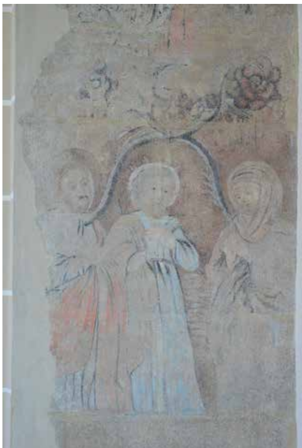
145–148. Arbor Virginis freska ir jos fragmentai. Vilniaus Šv. Mykolo bažnyčios interjero pietinė siena. Fot. Aloyzas Petrašius, 2015 m.