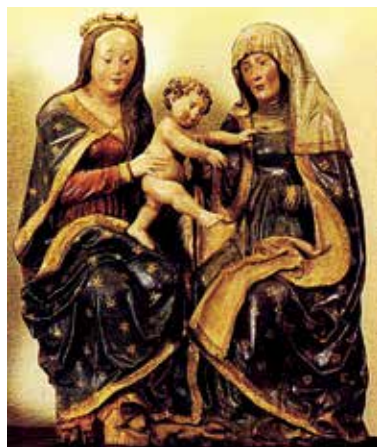
10. Šv. Ona, pati trečioji. XVI a. Udine miesto muziejus.