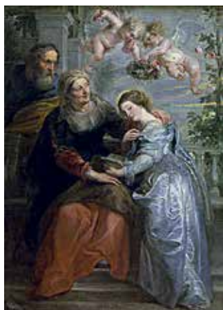
162. Švč. Mergelės Marijos auklėjimas. 1625–1626 m. Dail. Peter Paul Rubens. Royal Museum of Fine Arts, Antverpenas.