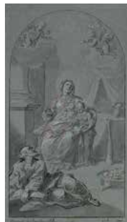
142. Švč. M. Marijos auklėjimas. XVIII a. I p. Dail. Simonas Čechavičius. Piešinys. NČDM