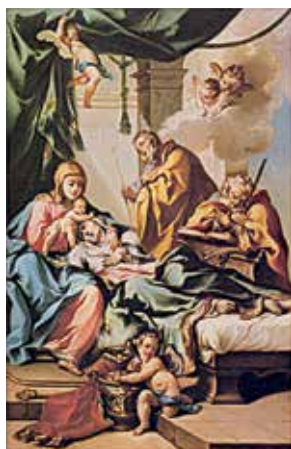
31. Šv. Onos mirtis. 1740 m. Dail. Francesco Monti (1646–1712). Paveikslas, buvęs San Zeno al Foro bažnyčioje Brescia (Lombardija).