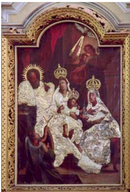
107. Šv. Onos šeima. XVII a. II p. Kretingos bažnyčios altorinis paveikslas prieš restauravimą.