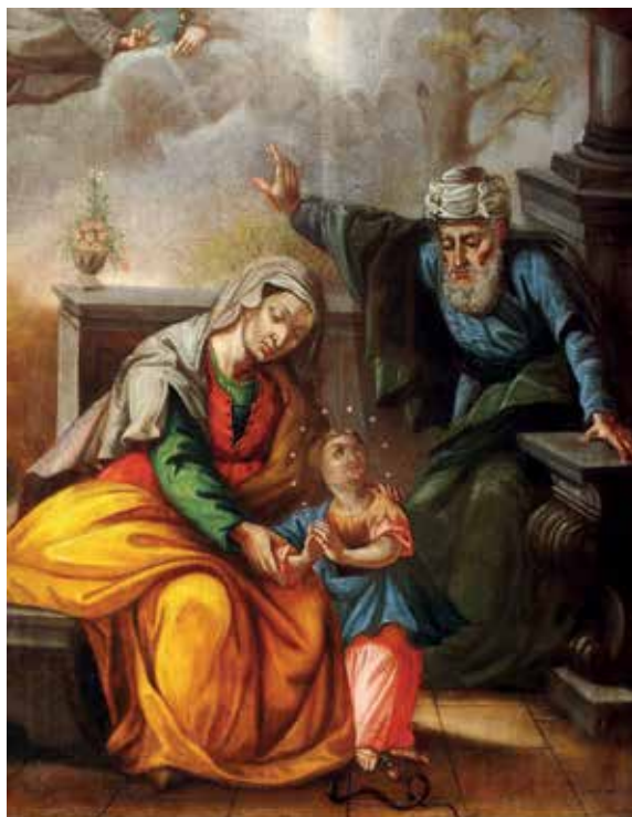
154–156. Švč. M. Marija Nekaltai Pradėtoji su šv. Ona ir šv. Joakimu. XVIII a. pab.–XIX a. vid. BPM.