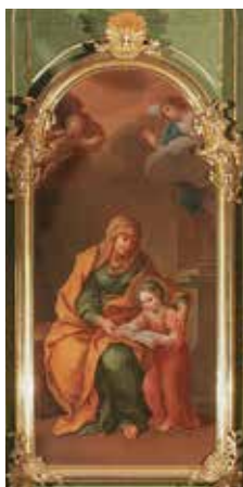
177. Švč. Mergelės Marijos auklėjimas. Po 1743 m. Dail. Simonas Čechavičius. Opole Lubelskie (Lenkija) buvusi pijorų parapiinė bažnyčia.