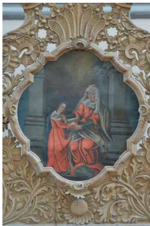
170. Švč. Mergelės Marijos auklėjimas. XVIII a. III ketv. Dotnuvos bernardinų bažnyčios procesijų altorėlio paveikslas.