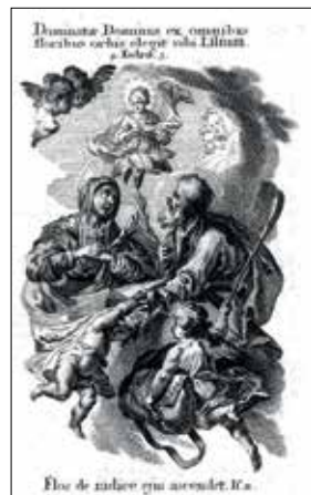
19. Arbor Virginis . XVIII a. graviūra. Vokietija.