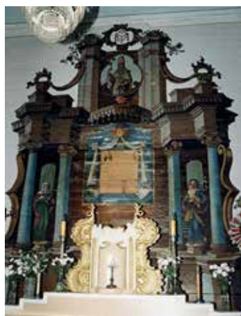
180. Didkiemio bažnyčios didysis altorius. XVIII a.