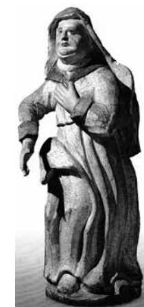
188. Šv. Onos skulptūra. Buvusi Viarkovichy bažnyčioje. XVIII a. vid. Baltarusijos senosios kultūros muziejus Minske.