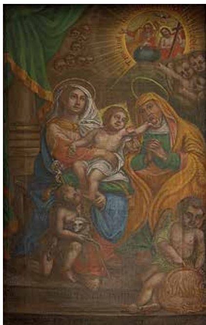
91. Šv. Ona, pati trečioji su šv. Jonu Krikštytoju. XVIII a. IV ketv. Šiluvos bazilikos altorinis paveikslas.