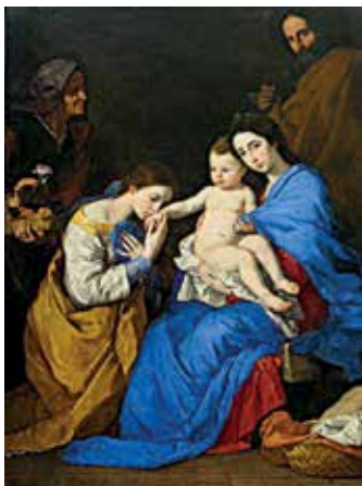
13. Šv. Šeima su šv. Ona ir šv. Kotryna Aleksandriete. 1648 m. Dail. José de Ribera.