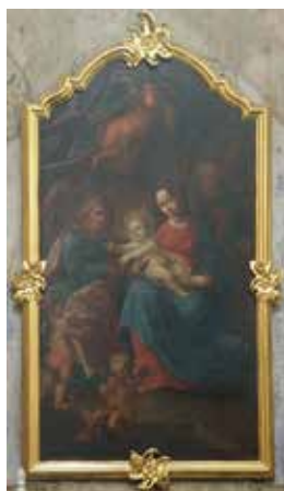
129. Šv. Onos Šeima. XVIII a. II p. Vilniaus Šv. Dvasios bažnyčia.