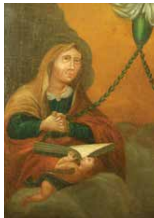
151. Arbor Virginis . XVIII a. pab.–XIX a. pr. Paveikslas fragmentas iš buvusios Kaunatavos Dievo Apvaizdos bažnyčios nešiojamo altorėlio. Kretingos muziejus.