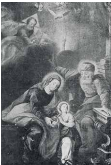
26. Švč. M. Marija Nekaltai Pradėtoji su šv. Ona ir šv. Joakimu. XVIII a. vid. arba pab. Chodlo Šv. Trejybės bažnyčia (Lenkija).