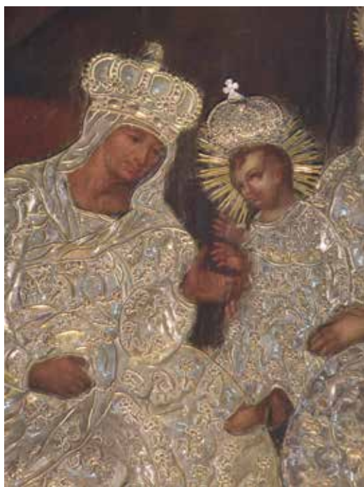
124. Šv. Ona, pati trečioji. Fragmentas. XVIII a. vid. (apie 1747–1762 m.). Jėzaus karūna – apie 1743 m., aptaisai, Švč. M. Marijos ir šv. Onos karūnos – XVIII a. III ketv. (apie 1762 m.). Vilniaus Šv. Onos bažnyčios didžiojo altoriaus paveikslas.