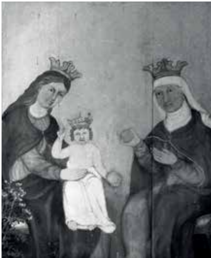
46–47. Šv. Ona, pati trečioji. XIX a. pab. Batakių bažnyčia. Procesijų altorėlio paveikslas.