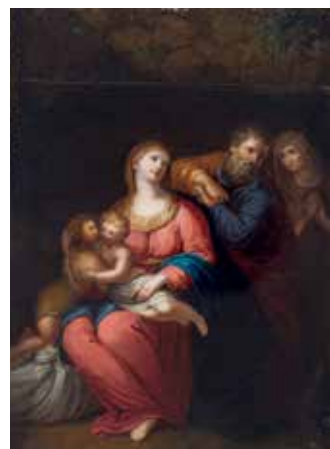
137. Šv. Onos Šeima. Než. italų dailininkas. XVIII a. pab. Miniatiūra. LDM