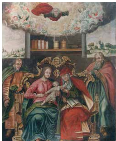
56. Šv. Onos Šeima. XVII a. I p. Privati nuosavybė.