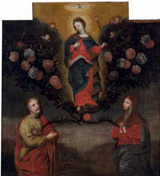
149. Švč. Mergelė Marija Nekaltai Pradėtoji. XVII a. II p.–XVIII a. pr. LDM.