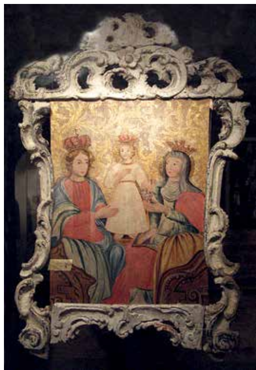
67. Šv. Ona, pati trečioji. XVII a. IV ketv. Paveikslas iš procesijų altorėlio. Trakų istorijos muziejus.