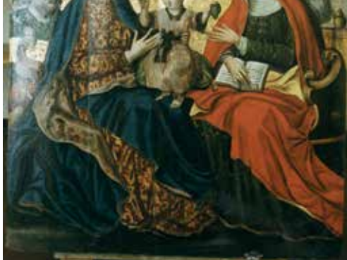
60. Šv. Onos Šeima. XVI a. II p.–XVII a. I p. Rūdinkų bažnyčia. Paveikslas nuotrauka prieš restauraciją.