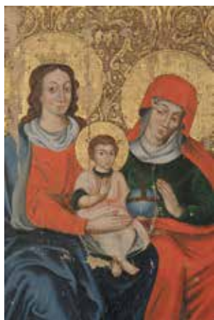
79. Šv. Ona, pati trečioji. Paveikslo fragmentas. LNM.