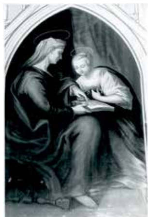
165. Švč. Mergelės Marijos auklėjimas (neiškilo). XIX a. Pakalnių bažnyčios altorinis paveikslas.