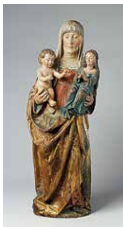
9. Šv. Ona, pati trečioji. XV a. II p. Vidurio Vokietija.