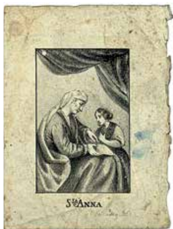
167. Švč. Mergelės Marijos auklėjimas. Lit. Józefas Ozębłowski. XIX a. 4–8 deš. LMABVB RSS.