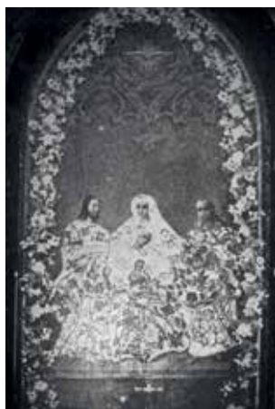
35. Šv. Onos šeima (neiškilo). Alvito bažnyčia.